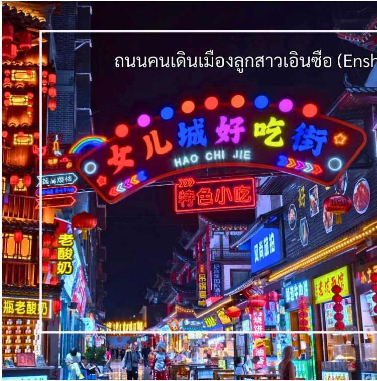
ถนนคนเดินเมืองลูกสาวเินซือ (Enshi Daughter City Pedestrian Street)