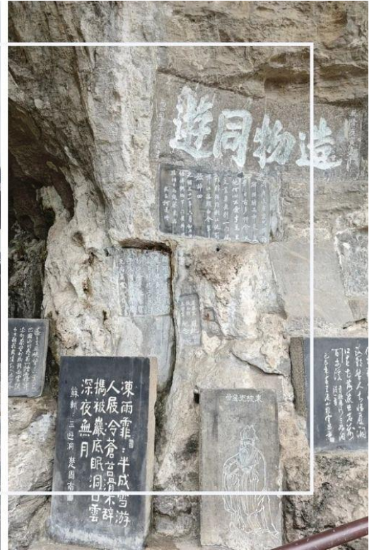
ถ้ำสามสหาย (SanYouDong)

เที่ยง บริการอาหารเที่ยง ณ ภัตตาคาร (มื้อที่ 14)