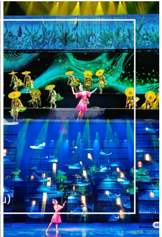
การแสดงโชว์ซีลิ่งคาปู (Xilan Kapu)

เดินทางเข้าโรงแรมที่พัก Xiazhou Hotel ระดับ 4 ดาวหรือเทียบเท่า