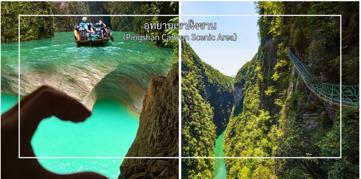
อุทยานเขาผิงซาน (Pingshan Canyon Scenic Area)

นำท่านสัมผัสความยิ่งใหญ่ที่เทียบระดับ 4A ที่ อุทยานเขาผิงซาน(Pingshan Canyon Scenic Area) หรือที่นักท่องเที่ยวรู้จักในชื่อ โกรกรูปหัวใจ (Heart-Shaped Gorge) เป็นหนึ่งในแลนด์มาร์กธรรมชาติที่สวยงามและมีเอกลักษณ์สวยงามด้วยรูปทรงโกรกที่คล้ายหัวใจซึ่งเกิดจากการกัดเซาะของสายน้ำและกระบวนการทางธรณีวิทยามายาวนาน ทำให้กลายเป็นจุดชมวิวที่โรแมนติกและเหมาะแก่การถ่ายภาพ ท่านสามารถเดินชมเส้นทางธรรมชาติรอบโกรก หรือมองจากจุดชมวิวสูงเพื่อเห็นภาพโกรกรูปหัวใจอย่างเต็มตา นอกจากความสวยงามแล้ว บริเวณนี้ยังเต็มไปด้วยธรรมชาติอันอุดมสมบูรณ์ ทั้งป่าไม้ ลำธาร และสัตว์ป่าที่อาศัยอยู่ในพื้นที่ ทำให้เป็นจุดหมายที่ผสมผสานทั้งความงดงามและความสงบแห่งธรรมชาติ (รวมล่องเรือ)