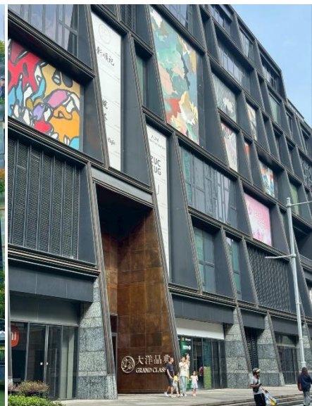
ห้างสรรพสินค้า