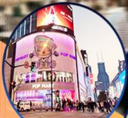
ถนนหนานจิง