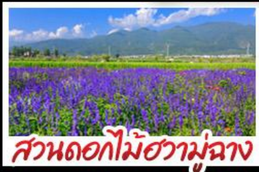
สวนดอกไม้ฮาวอวู้มู่ฉ่าง