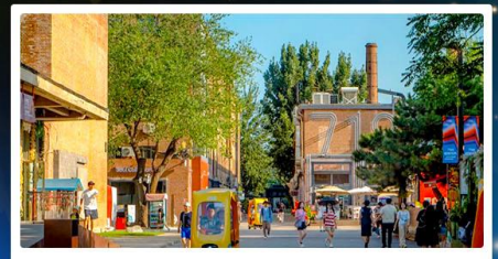
798 Art District