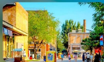
798 Art District