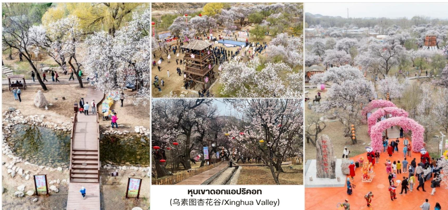
หุบเขาดอกแอปริคอต (乌素图杏花谷/Xinghua Valley)

จากนั้นนำท่านเดินทางสู่ เมืองดัลลาเทอจี (Dalad Banner, 达拉特旗) เป็นเขตปกครองย่อย (Banner) แห่งหนึ่งภายใต้การบริหารของเมืองเออร์ตัวซือ (Ordos City) ในเขตปกครอง ตนเองมองโกเลียใน ประเทศจีน