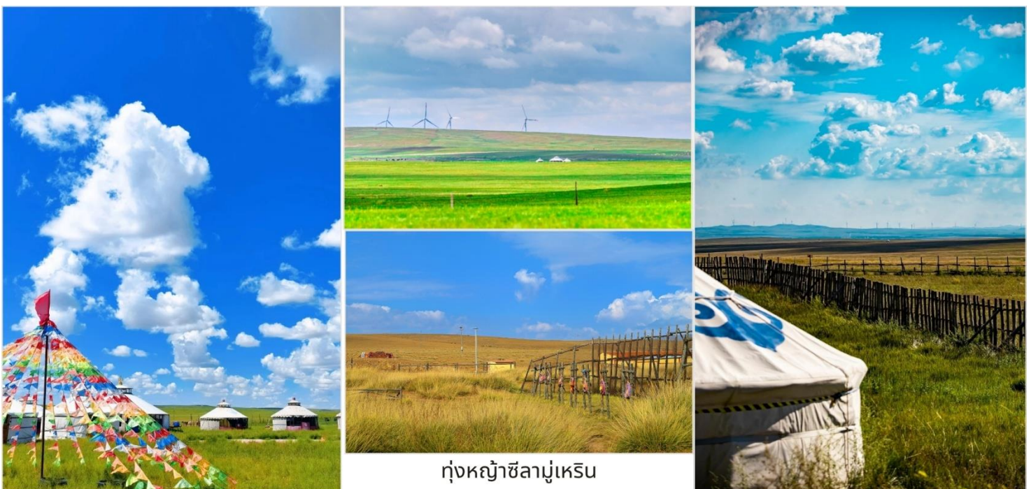
ทุ่งหญ้าซิลามูเหริน