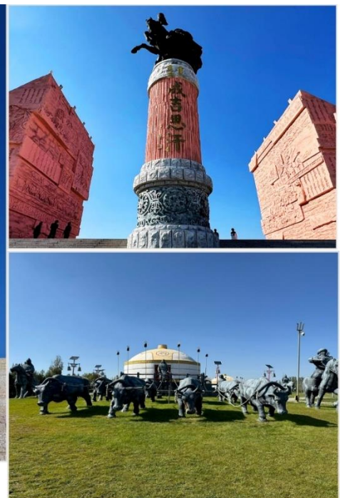
เขตท่องเที่ยวเจงกิสข่าน • กลุ่มประติมากรรม กองทัพเหล็กและกระโจมทอง