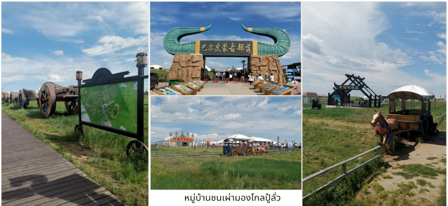
หมู่บ้านชนเผ่ามองโกลปูแล้ว

นำท่านชม หมู่บ้านชนเผ่ามองโกลปูแล้ว (蒙古部落 - Mongol Buluo) ชนเผ่าเร่ร่อนมองโกเลียสืบทอดวิถีชีวิตแบบดั้งเดิมมาหลายพันปี พวกเขาจะย้ายถิ่นฐานตามฤดูกาล และเลี้ยงสัตว์เป็นอาชีพหลัก (ม้า แกะ แพะ วัว