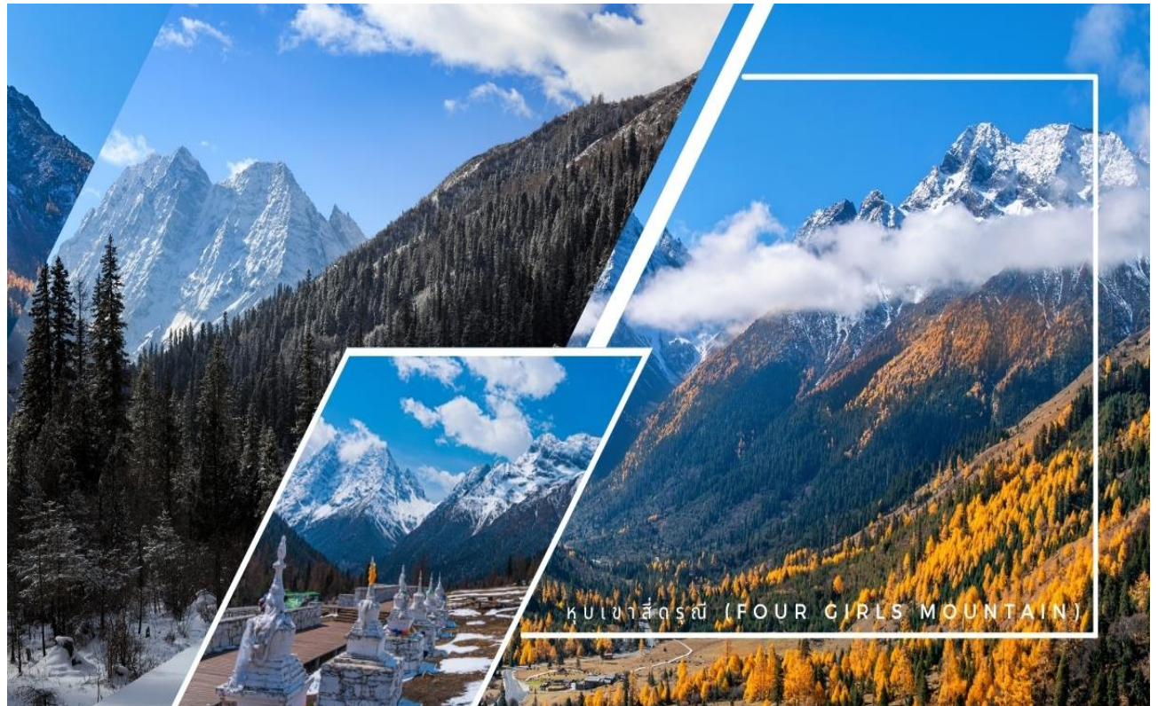
ภูเขาสี่ดรุณี (FOUR GIRLS MOUNTAIN)

URGENT! เส้นทางนี้...เดินทางสู่พื้นที่สูงมากกว่า 2,500 เมตรจากระดับน้ำทะเล เนื่องจากมีความดันอากาศและออกซิเจนลดลง อาจจะเกิดการแพ้ที่ราบสูงได้ หากมีอาการกรอกรับแจ้ง ไกด์หรือหัวหน้าทัวร์