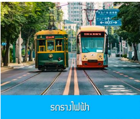
รถรางไฟฟ้า