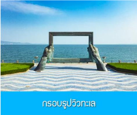
กรอบรูปวิวกทะเล