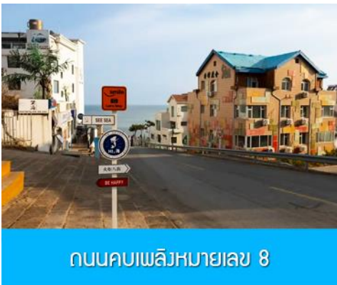
ถนนคบเพลิงหมายเลข 8

นำท่านชมสวนสาธารณะเว่ยไห่ 威海公园 สวนสาธารณะริมทะเลที่ใหญ่ที่สุดของเมืองเว่ยไห่ ให้ท่านชมและถ่ายภาพคู่กับ กรอบรูปยักษ์วิวกทะเล 威海公园大相框 แลนด์มาร์คที่เป็นอีกหนึ่งไฮไลท์ที่สุดฮิตของเว่ยไห่