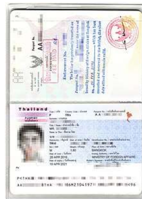
Passport เต็ม 2 หน้า