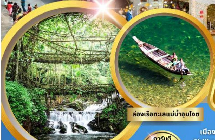
ล่องเรือทะเลแม่น้ำจุมโจต