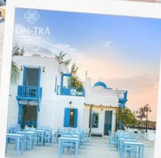
ซานทริน่าคาเฟ่