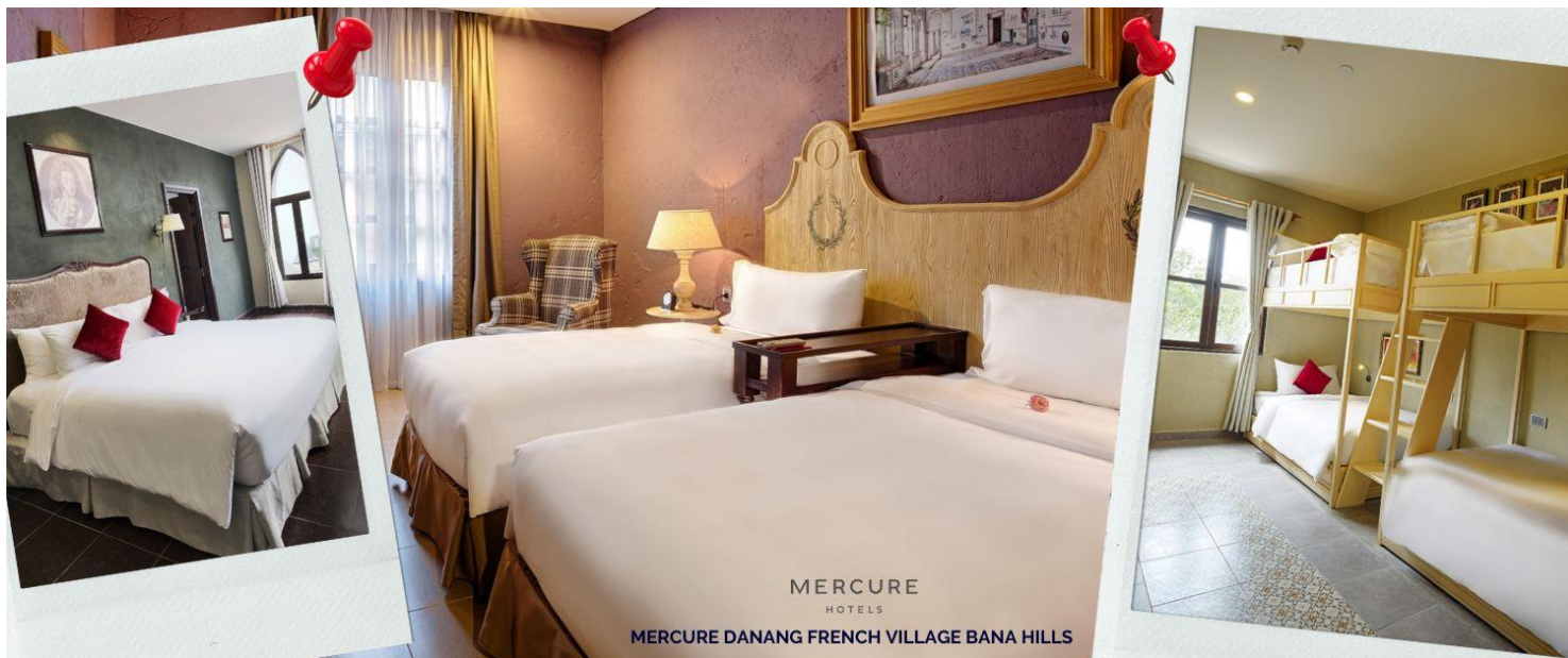
MERCURE HOTELS MERCURE DANANG FRENCH VILLAGE BANA HILLS

สำหรับคืน ที่พักบนบานาฮิลล์ อาจมีการสลับกับ โดยรายการท่องเที่ยวอาจมีการปรับเปลี่ยนตามความเหมาะสม