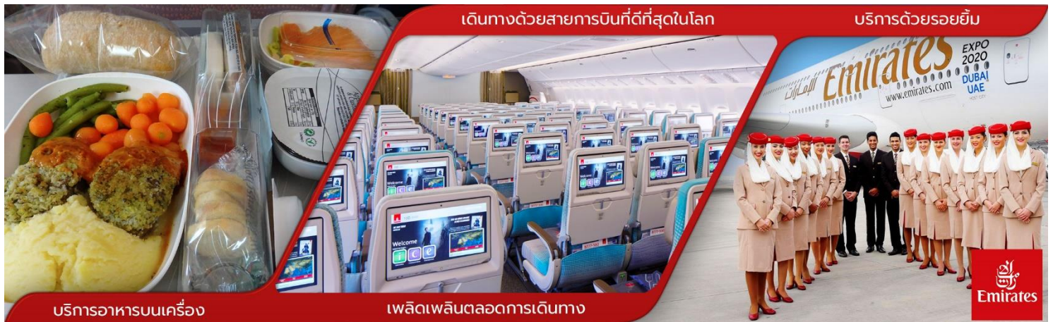
บริการอาหารบนเครื่อง

02.50 น. ✈️ ออกเดินทางสู่ สนามบิน BKK-DXB ทำอากาศยานนานาชาติดูไบ โดยสายการบินเอมิเรตส์ Emirates EK เที่ยวบินที่ EK377 (ใช้เวลาเดินทาง 7 ชั่วโมง) (บริการอาหารและเครื่องดื่มบนเครื่อง)