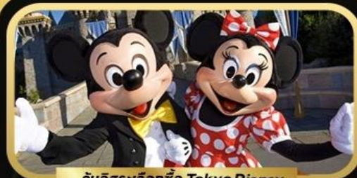
วันอิสระเลือกซื้อ Tokyo Disney