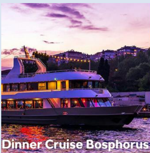
Dinner Cruise Bosphorus

ล่องเรือไปตามช่องแคบบอสฟอรัส ช่องแคบที่เป็นพรมแดนกั้นระหว่างทวีปยุโรปและทวีปเอเชียบรรยากาศริมสองฝั่งแม่น้ำ ที่ภูมิสถาปัตยกรรมมีความแตกต่างกันอย่างเห็นได้ชัดระหว่างกลิ่นอายของยุโรป และกลิ่นอายความเป็นเอเชีย ระหว่างการล่องเรือ จะได้ชมเมืองที่มีชีวิตชีวาด้วยแสงไฟสว่างไสวในยามค่ำคืนค่าคืน พร้อมรับชมการแสดงโชว์อันตระการตา