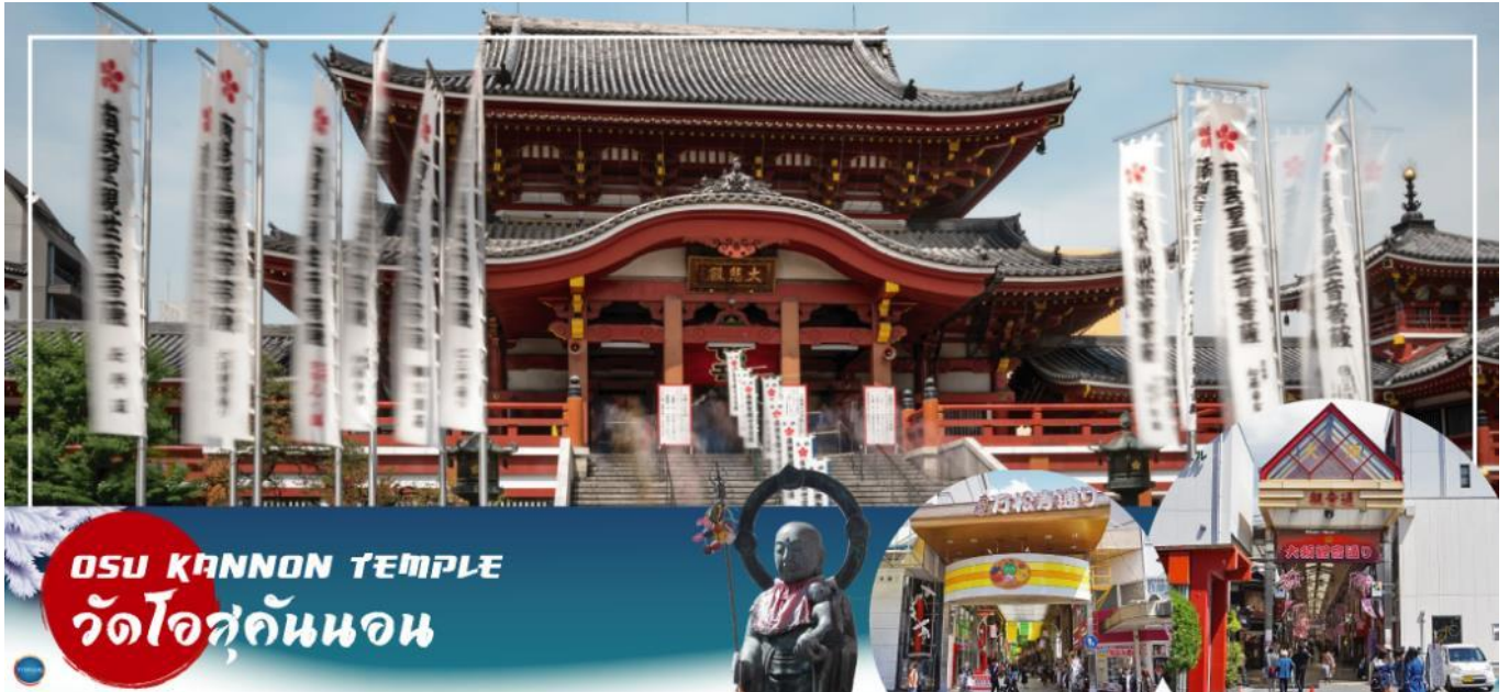
OSU KANNON TEMPLE วัดโอสถคันนอน

วันที่สาม เมืองนาโกย่า – วัดโอสถคันนอน – ย่านช้อปปิ้งโอส – เมืองทาคายามะ – ถนนชั้นมาจิซุจิ หมู่บ้านมรดกโลก ชิราคาวาโกะ – งานประดับไฟฤดูหนาวชิราคาวาโกะ – เมืองกุโจ