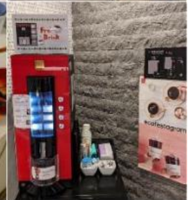
Sarasa Hotel Shinsaibashi