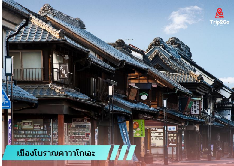
เมืองโบราณคาวาโกเอะ

ปัจจุบัน โกดังส่วนใหญ่ได้เปลี่ยนเป็นร้านค้าและร้านอาหารแล้ว แต่ภายในยังคงให้ความรู้สึกแบบญี่ปุ่นยุคก่อนเหมือนเดิม โกดังหลังหนึ่งถูกทำเป็นพิพิธภัณฑ์คุระซุคุริ ซึ่งมีการจำลองภายในของโกดังสมัยก่อน ให้คุณได้เข้าใจถึงชีวิตประจำวันในสมัยเอโดะ จุดสังเกตที่เด่นที่สุดในย่านโกดังคือ หอระฆัง โดยสัญลักษณ์ของเมืองนี้จะส่งเสียงวันละสี่เวลา อีกที่หนึ่งที่ควรไปชมก็คือ แคนดี้อัลเลย์ หรือ ตรอกลูกกวาด ถนนแคบๆ ที่มีร้านขายลูกอมญี่ปุ่นเก่าแก่ตั้งอยู่ถึง 20 ร้าน