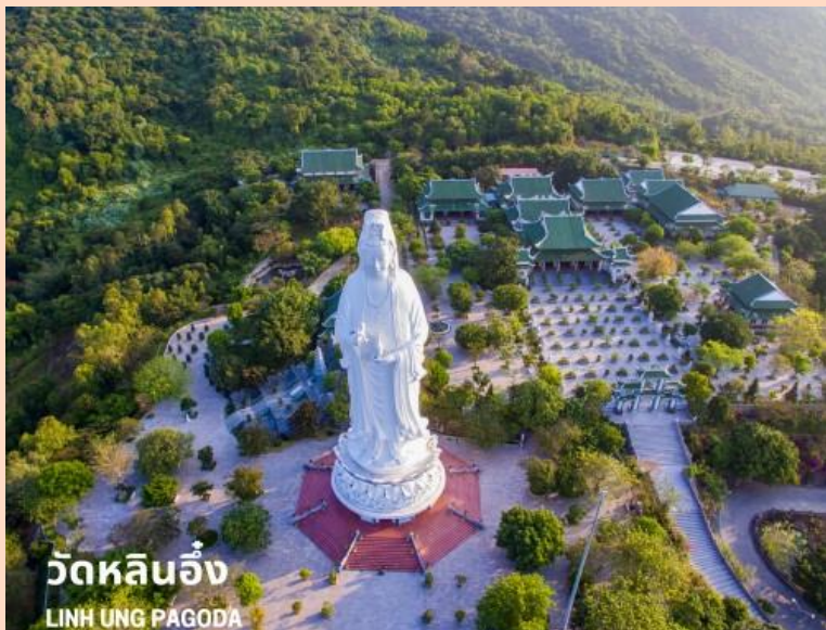
วัดหลินอิ่ง LINH UNG PAGODA

จากนั้นนำท่านเลือกซื้อกาแฟเวียดนามอันเลื่องชื่อ ณ ร้านกาแฟเวียดนาม Palm Beach เป็นของฝากกลับบ้าน