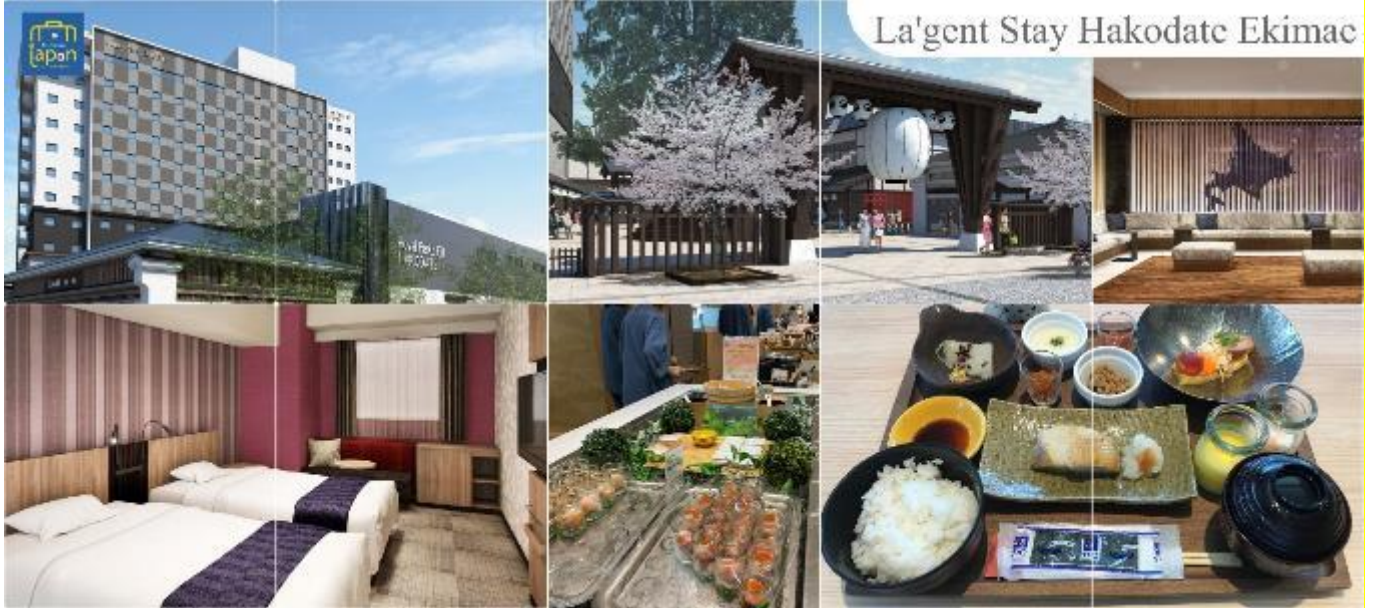
La'gent Stay Hakodate Ekimae

วันที่สาม เมืองฮาโกดาเตะ – ป้อมโกเรียวกาคู (เช้าชม) – โกดังอิฐแดง – ทะเลสาบโทยะ – ศูนย์อนุรักษ์พันธุ์หมีสีน้ำตาล – ออนเซน