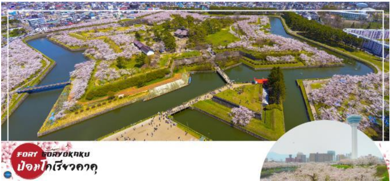
FORT GORYOKAKU ป้อมโกเรียวกาคู

วันที่สาม เมืองฮาโกดาเตะ – ป้อมโกเรียวกาคู (เช้าชม) – โกดังอิฐแดง – ทะเลสาบโทยะ – ศูนย์อนุรักษ์พันธุ์หมีสีน้ำตาล – ออนเซน