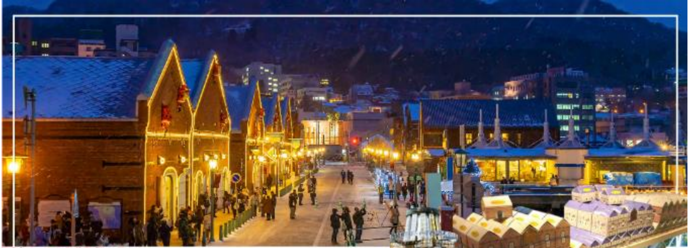
KANEMORI RED BRICK WAREHOUSE โกดังอิฐแดง

อิสระให้ท่านเดินเล่น ณ โกดังอิฐแดงริมน้ำ (Red Brick Warehouses) ได้ปรับปรุงมาจากคลังสินค้าอิฐสีแดงที่เคยใช้ค้าขายในปลายสมัยเอโดะ ตั้งอยู่ริมแม่น้ำของอ่าวฮาโกดาเตะ ศูนย์รวมแหล่งช้อปปิ้ง ร้านอาหาร และสถานบันเทิงที่ให้บรรยากาศเก่าๆ นอกจากนี้ร้านขายของที่ระลึกที่ทันสมัย เสื้อผ้าแฟชั่น ร้านขายอุปกรณ์ตกแต่งบ้าน และร้านขนมหวานแล้ว ยังมีร้านอาหาร ลานเบียร์ โบสถ์สำหรับจัดพิธีแต่งงาน และบริการล่องเรือเพื่อชมวิวทิวทัศน์ของอ่าวฮาโกดาเตะอีกด้วย