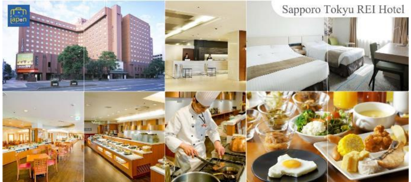
Sapporo Tokyu REI Hotel

SAPPORO TOKYU REI HOTEL หรือเทียบเท่าระดับเดียวกัน