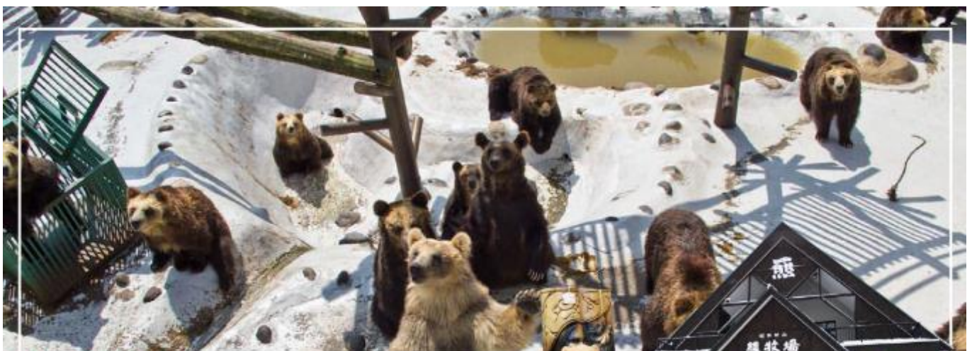
SHOW SHINZAN BEAR PARK ศูนย์อนุรักษ์พันธุ์หมีสีน้ำตาล

นำท่านชม ศูนย์อนุรักษ์พันธุ์หมีสีน้ำตาล (Bear Park) ซึ่งเป็นหมีพันธุ์ที่หาได้ยากในปัจจุบัน จะพบแต่ในเกาะฮอกไกโด เกาะซาคาริน และหมู่เกาะคุรินเท่านั้น เรียกได้ว่าเป็นจุดน่าแวะของคนรักเจ้าหมีสีน้ำตาลที่พลาดไม่ได้เลย