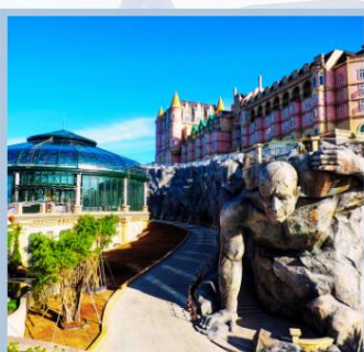
หมู่บ้านฝรั่งเศส