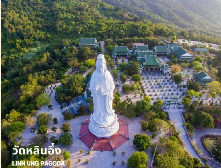
วัดหลินอึ้ง LINH UNG PAGODA

เดินทางสู่ วัดหลินอึ้ง (LINH UNG PAGODA) เป็นวัดที่ใหญ่ที่สุดของเมืองดานัง อยู่บนคาบสมุทร เซินจา ภายในวิหารใหญ่ของวัดเป็นสถานที่บูชาเจ้าแม่กวนอิมและเทพองค์ต่างๆ ไฮไลท์ของวัดนี้เป็นที่ประดิษฐานเจ้าแม่กวนอิมยืนองค์ใหญ่สีขาว ที่มีความสูงถึง 67 เมตรตั้งอยู่บนฐานดอกบัวกว้าง 35 เมตร ยื่นหน้าออกไปทางทะเลและหันหลังให้ภูเขา คอยปกป้องคุ้มครองวัดนี้เป็นสถานที่ศักดิ์สิทธิ์ที่ชาวบ้านนิยมมากราบไหว้ขอพรและยังเป็นอีกหนึ่งสถานที่ท่องเที่ยวจุดชมวิวที่สวยงามของเมืองดานังอีกด้วย