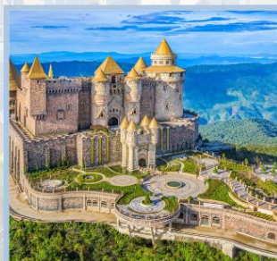
ปราสาทจีนตรา