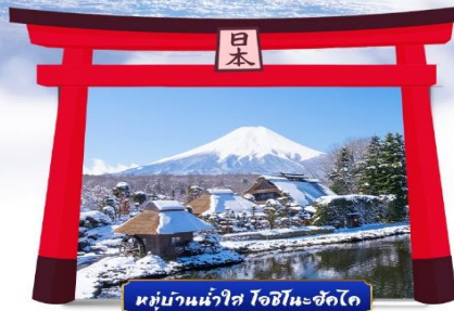
หมู่บ้านน้ำใส โอชิโนะซึกิโด