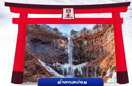
น้ำตกเคงอน