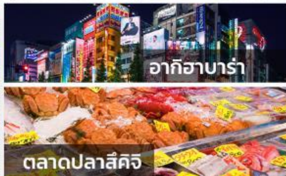
อาคิฮาบาระ