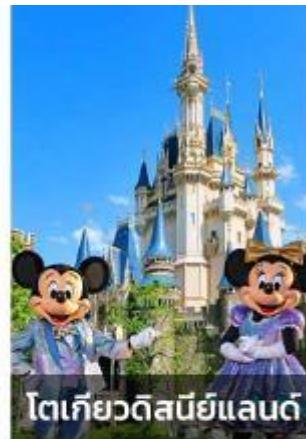
โตเกียวดิสนีย์แลนด์