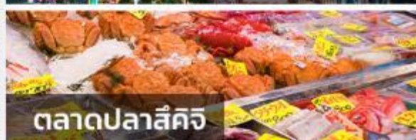
ตลาดปลาชิชิ

อิสระตามอัธยาศัยทั้งวันให้ท่านเลือกช้อปปิ้งตามย่านดังของกรุงโตเกียว โดยการนั่งรถไฟทะเลียมมหานครโตเกียว (ไม่รวมค่ารถไฟ) โดยทางหัวหน้าทัวร์จะแนะนำสถานที่ท่องเที่ยวต่าง ๆ ให้กับท่านโดยละเอียด ท่านสามารถนั่งรถไฟ JR เพื่อเที่ยวสถานที่ท่องเที่ยวที่มีชื่อเสียงไม่ว่าจะเป็น