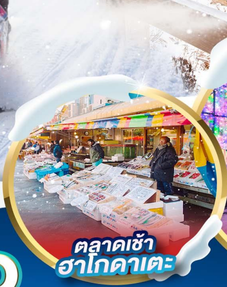
ตลาดเช้า ฮาโกดาเตะ