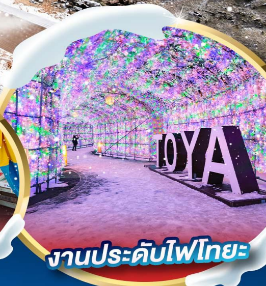
งานประดับไฟไทยะ