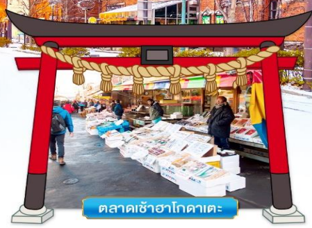
ตลาดเช้าฮาโกดาเตะ