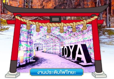
งานประดับไฟไทยะ

พิเศษ! บุฟเฟต์ขาปูยักษ์ 3 ชนิด, แช่น้ำแร่ออนเซน