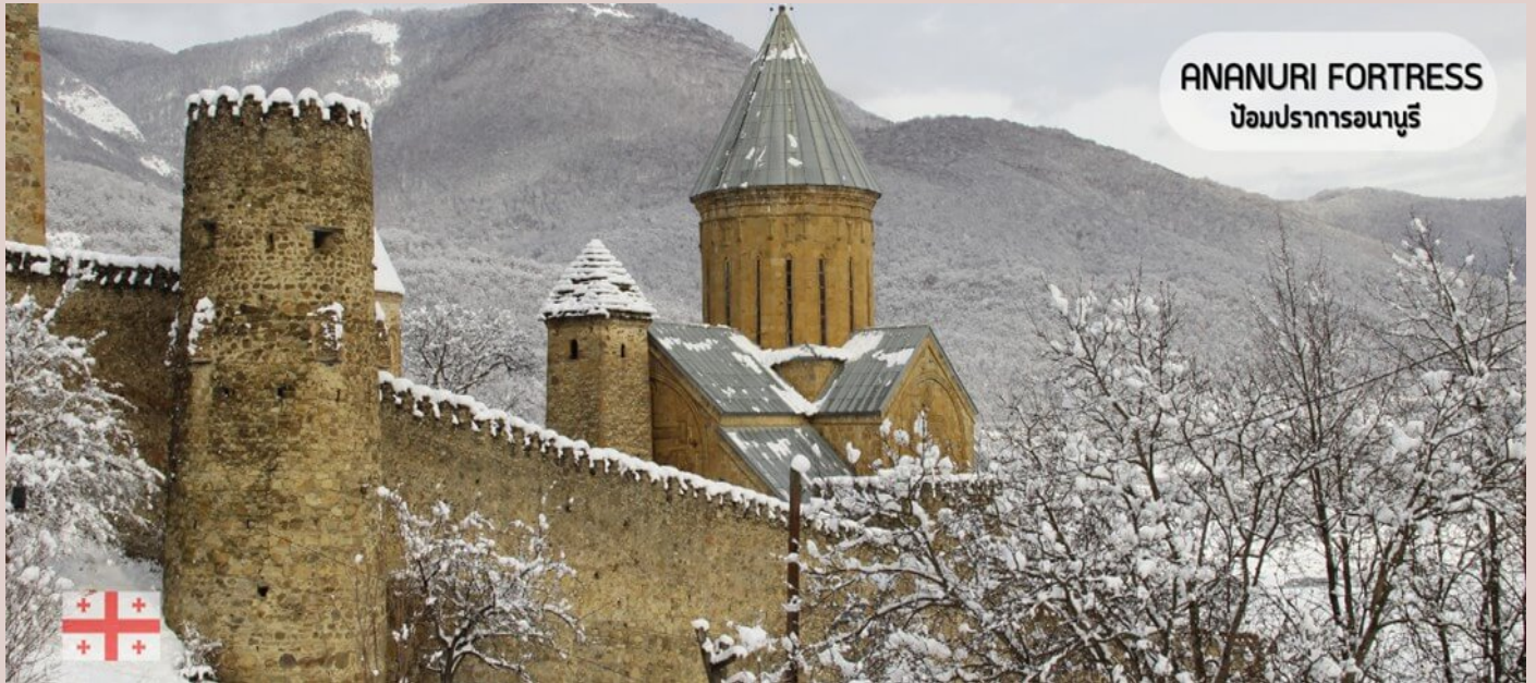
ANANURI FORTRESS ป้อมปราการอนานูรี

ชม UNESCO world Heritage มรดกโลกแห่งจอร์เจีย! วิหารจวารีโบสถ์แห่งไม้กางเขนศักดิ์สิทธิ์ และวิหารสเวติสโคเวลี (Svetitskhoveli Cathedral) หรือเสาที่มีชีวิต