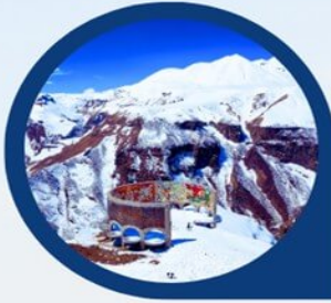
จุดถ่ายรูป Panorama Gudauri