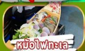
หม้อไฟทะเล