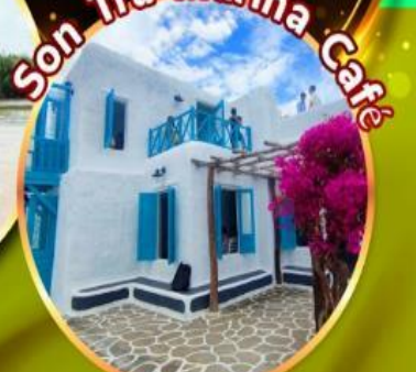
Son Tra Marina Cafe