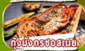
กุ้งมังกรช่อสเนย