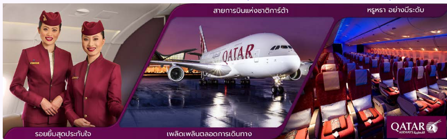
รอยยิ้มสุดประทับใจ

02.30 น. ✈️ ออกเดินทางสู่ สนามบินท่าอากาศยานนานาชาติโดฮา ประเทศกาตาร์ โดยสายการบินการ์ต้าแอร์เวย์ เที่ยวบินที่ QR837 (บริการอาหารและเครื่องดื่มบนเครื่อง)