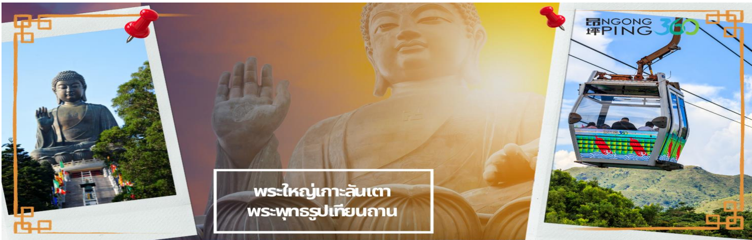
พระใหญ่เกาะลันเตา พระพุทธรูปเทียนถาน