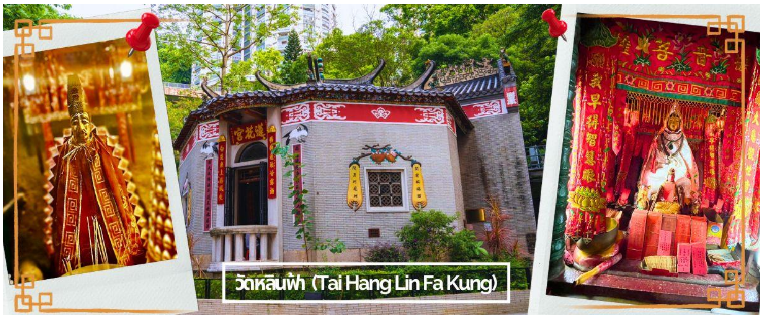
วัดหลินฟ้า (Tai Hang Lin Fa Kung)

จากนั้นนำท่านเดินทางสู่ วัดหลินฟ้า (LIN FA KUNG TEMPLE) หรือ วัดดอกบัว เป็นวัดจีนตั้งอยู่บริเวณหว่านจ่าย คอสเวย์เบย์ มีเจ้าแม่กวนอิม เป็นองค์ประธานของวัด สร้างขึ้นในปี 1863 มีตำนานเล่าว่าเจ้าแม่กวนอิมเคยปรากฏกายที่วัดแห่งนี้ เป็นที่เลื่อมใสของชาวบ้าน จึงร่วมใจกันสร้างวิหารลักษณะคล้ายดอกบัวนี้ขึ้น และประดับด้วยโคมไฟดอกบัวร้อยโคม เมื่อมองเข้าไปด้านในวิหารจะทำให้รู้สึกถึงความเจริญรุ่งเรือง เปรียบเสมือนว่าแค่มาไหว้เจ้าแม่กวนอิมที่วัดแห่งนี้ก็จะทำให้ผู้มาเยือนได้มีวัดที่เจริญรุ่งเรืองยิ่งขึ้นไป และยังมี เทพเจ้าฮั่วจื่อเอี๊ยะ (เทพเจ้าสายนรก) เป็นเทพที่ขึ้นชื่อเรื่องความกตัญญู และด้านเงินทอง ผู้ใดที่ได้ไปไหว้ขอพรท่าน เชื่อว่าจะทำให้มีโชคลาภแบบไม่คาดคิด และสมหวังอย่างรวดเร็ว ใครที่ชอบเสียงโชค เสียงดวง ห้ามพลาดเลยทีเดีย