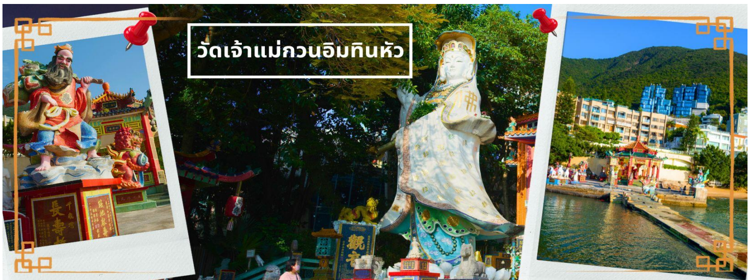
วัดเจ้าแม่กวนอิมหินหัว

จากนั้นนำท่านเดินทางสู่ วัดเจ้าแม่กวนอิมหินหัว อ่าวรีพัลส์เบย์ (TIN HAU TEMPLE REPULSE BAY) ตั้งอยู่ริมทะเล เป็นสถานที่ท่องเที่ยวสำคัญ สร้างขึ้นในปี ค.ศ. 1993 วัดแห่งนี้ถูกสร้างขึ้นเพื่อคุ้มครองชาวประมงในการออกเรือไปหาปลา ซึ่งเป็นหนึ่งในวัดที่เก่าแก่ที่สุดของฮ่องกง บริเวณวัดจะมี เจ้าแม่กวนอิมองค์ใหญ่ ปางประทานพรตั้งอยู่ เป็นเทพที่ชาวฮ่องกงและคนจีนให้ความเคารพนับถือมากที่สุด สามารถขอพรได้ทุกเรื่อง วัดนี้เป็นที่นิยมมีนักท่องเที่ยวเดินทางมาขอพรกันมากมาย เพราะเชื่อในความศักดิ์สิทธิ์ และยังมี เจ้าแม่ทับทิม หรือ เทพธิดาแห่งท้องทะเลองค์ใหญ่ ซึ่งคนฮ่องกง คนมาเก๊า และคนจีน ที่อยู่ริมทะเล ชาวประมง นักเดินเรือหรือผู้ที่เดินทางทางเรือเป็นประจำ จะนับถือเจ้าแม่ทับทิมเป็นอย่างมาก มีความเชื่อว่าเจ้าแม่ทับทิมจะปกป้องเราจากภัยอันตรายระหว่างการเดินทาง ภายในวัดยังมีเทพเจ้าและพระพุทธรูปต่างๆ ประดิษฐานไว้มากมายตามความเชื่อถือศรัทธา เช่น เทพเจ้าไฉซิงเอี้ย ให้อโชโคลลาภความมั่งคั่ง ความร่ำรวย, พระสังกัจจายน์โพธิสัตว์ เทพประทานบุตร-ธิดา ให้อโชธิฐานขอลูก, สะพานต่ออายุ (สะพานอายุยืน) สะพานสีแดงตั้งอยู่บนริมหาด สีแดงสด เชื่อกันว่า คนจีนเชื่อกันว่าหากเดินข้ามสะพานนี้ เราจะมีอายุยืนขึ้นอีก 3 วัน (3 วัน บนสวรรค์ = 3 ปี บนโลกมนุษย์) นั้นหมายความว่า ถ้าเราเดินข้ามสะพานนี้แล้ว จะมีอายุยืนยาวขึ้นอีก 3 ปี บนโลกมนุษย์, เทพเจ้าแห่งความรัก ให้อโชเนื้อคู่, ศาลา 8 เหลี่ยม เชื่อกันว่าเป็นจุดที่มีดวงจ्यूดีที่สุด ภายในศาลาแปดเหลี่ยม จุดกึ่งกลางของพื้นจะมีรูปแปดเหลี่ยม ให้เราไปยื่นขอพรจากตำแหน่งนี้เพื่อขอพรหลังจากสวรรค์ และอีกมากมายให้ท่านได้สักการะบูชา