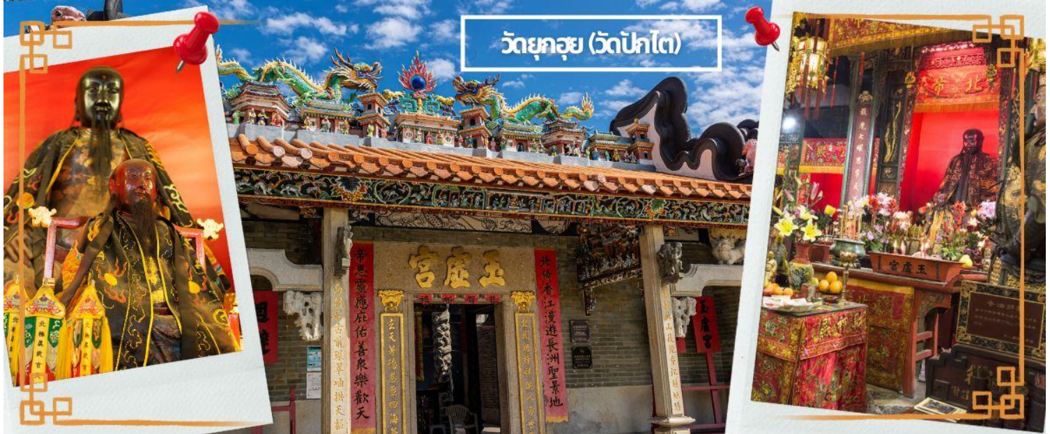
วัดยุกอย (วัดปากไต่)

กลายเป็นเรื่องดี หรือคนที่เป็นศัตรูของเราเปลี่ยนใจมาเป็นมิตร เป็นที่นิยมอย่างมากของชาวท้องถิ่นฮ่องกงมากราบไหว้ขอพรกันที่วัดนี้