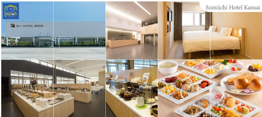
Sumiichi Hotel Kansai

พักที่ SUMIICHI HOTEL KANSAI หรือเทียบเท่าระดับเดียวกัน