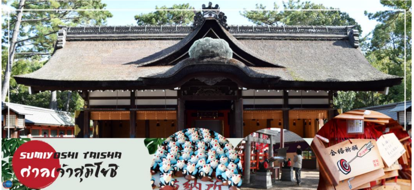
SUMIYOSHI TAISHA ศาลเจ้าสุมิโยชิ

เที่ยง รับประทานอาหารกลางวัน ณ ภัตตาคาร (2)