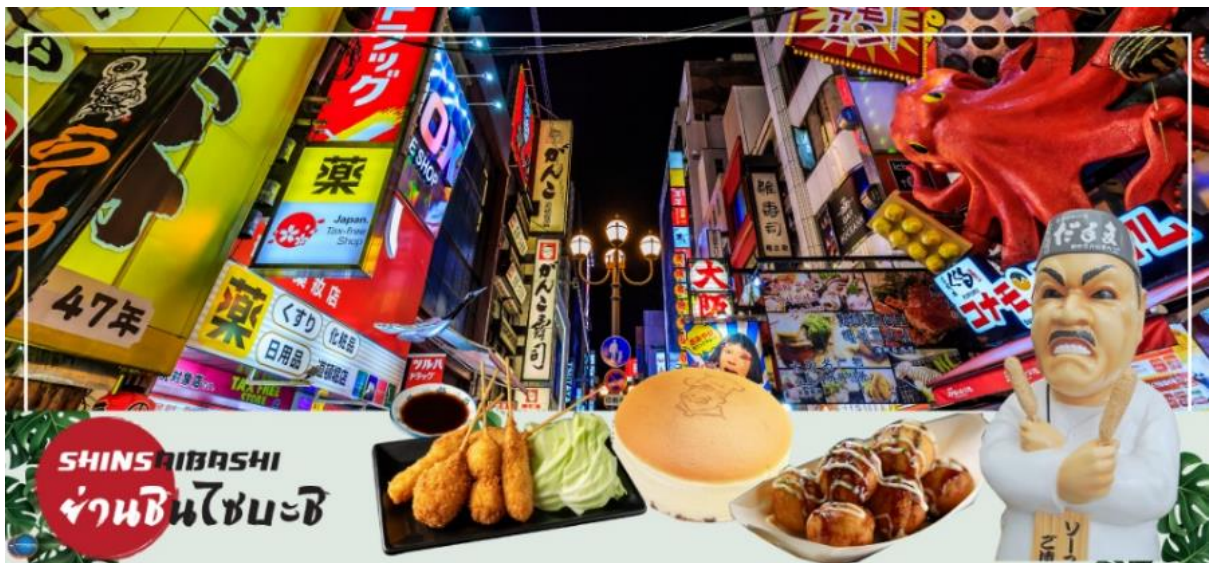
รับรองไม่ผิดหวังแน่นอน

H&M Beans ABC Mart เป็นต้น เรียกว่ามีทุกอย่างที่ต้องการรวมกันอยู่บริเวณนี้ ใกล้กันท่านสามารถเดินไปยัง ย่านโดทงโบริ (Dotonbori) ย่านบันเทิงยามค่ำคืนตลอดแนวถนนเลียบบคลองโดทงโบริ จากสะพานโดทงโบริมาชิไปจนถึงสะพานนิปปอนมาชิ ไฮไลท์!!! ใครๆ ก็เซ็คอิน ถ่ายภาพคู่ ป้ายกูลิโกะแมน หรือ ป้ายโดทงโบริกูลิโกะ (Dotonbori Glico Sign) เป็นป้ายไฟนีออนรูปนักกรีฑากำลังวิ่งอยู่บนลู่วิ่ง ซึ่งถูกติดตั้งมาตั้งแต่ ปี ค.ศ.1935 นอกจากนี้ยังมีอีกหนึ่งสัญลักษณ์สถานที่นัดพบกันหลง นั่นก็คือ ร้านปูคานิดอรากุ (Kani Doraku) ซึ่งมีปูยักษ์ขยับแขนและลูกตาได้อีกด้วย และห้ามพลาดสำหรับ ทาโกยากิ อาหารท้องถิ่นของชาวโอซาก้า ที่มาถึงถิ่นแล้วต้องลอง Original Taste