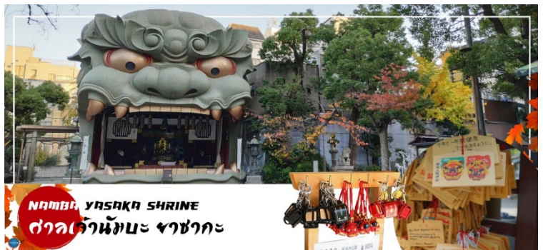
NAMBA YASAKA SHRINE ศาลเจ้านัมบะ ยะชะกะ

รูปปั้นหน้าสิงโตอัปปากขนาดใหญ่ ที่เชื่อกันว่า สามารถกลืนกินปีศาจร้าย หรือ สิ่งไม่ดีทั้งหลาย ให้หายไป และนำพามาซึ่งความโชคดีให้แก่ผู้คน ปัจจุบันนักเรียน นักศึกษา และผู้ประกอบการธุรกิจนั้น นิยมมาขอพรให้ประสบความสำเร็จกันที่นี่ ด้วยความสูง 17 เมตร ความกว้าง 11 เมตรและความลึก 7 เมตร อีสระให้ทุกท่านสักการะ และเก็บภาพที่ ศาลเจ้านัมบะ ยะชะกะ