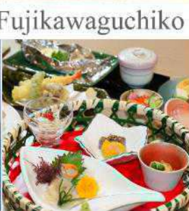
Yukari No Mori Fujikawaguchiko