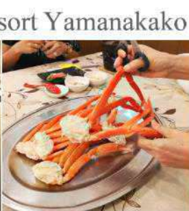
Hotel Alexander Royal Resort Yamanakako