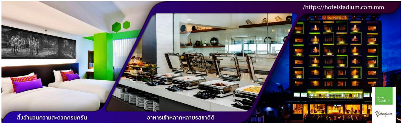
สิ่งอำนวยความสะดวกครบครัน

คำ 📍 รับประทานอาหารค่ำ ณ ภัตตาคาร เมนูพิเศษ!!เปิดปากกึ่ง+สลัดกุ้งมังกร 🏠 นำท่านเข้าพักที่ HOTEL STADIUM YANGON ระดับ 3 ดาว