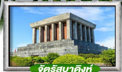
จิ๋อจี้ซุ่ยผาดิงท์