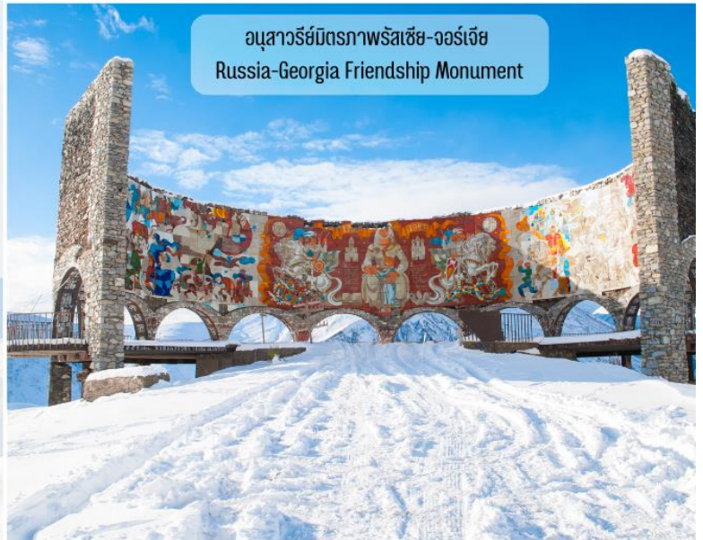
อนุสาวรีย์มิตรภาพรัสเซีย-จอร์เจีย Russia-Georgia Friendship Monument

แวะจุดถ่ายรูปแบบพาโนรามา 360 องศา ณ อนุสาวรีย์มิตรภาพรัสเซีย-จอร์เจีย (Russia-Georgia Friendship Monument) เป็นอนุสาวรีย์ที่โครงสร้างทั้งหมดทำจากหินและคอนกรีตทรงกลมขนาดใหญ่ ถูกสร้างขึ้นในปี ค.ศ. 1983 เพื่อเฉลิมฉลองเนื่องในโอกาสครบรอบ 200 ปี ของสนธิสัญญา Georgievsk ภายในตกแต่งด้วยกระเบื้องโมเสกสีอันสดใส บอกเล่าถึงเรื่องราวประวัติศาสตร์และวิถีชีวิตของชาวรัสเซียและชาวจอร์เจียเอาไว้ อนุสาวรีย์แห่งนี้ตั้งตระหง่านอยู่บนหุบเขา สามารถชมวิวดั้งแบบพาโนรามา 360 องศา และยังสามารถมองเห็นหุบเขาปีศาจ (Devil's Valley) ซึ่งเป็นส่วนหนึ่งของเทือกเขาคอเคซัส