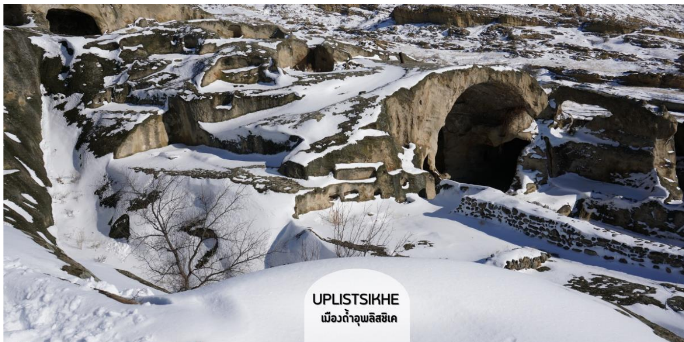
UPLISTSIKHE เมืองถ้ำอุปลิสสิเค