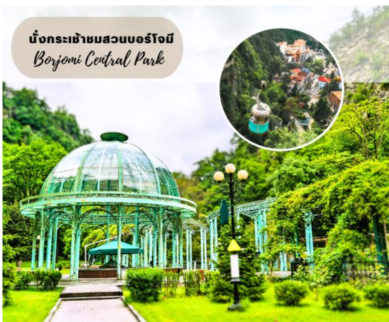
นั่งกระเช้าชมสวนบอร์โจมี Borjomi Central Park

ชม สวนบอร์โจมี (BORJOMI CITY PARK) สถานที่ท่องเที่ยวและพักผ่อนของชาวเมืองบอร์โจมีที่นิยมมาเดินเล่น และผ่อนคลายโดยการแช่น้ำแร่ในวันหยุด จากนั้นนำท่านนั่งกระเช้าสู่จุดชมวิวบนหน้าผาเหนือสวนบอร์โจมี