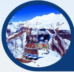
จุดถ่ายรูป Panorama Gudauri