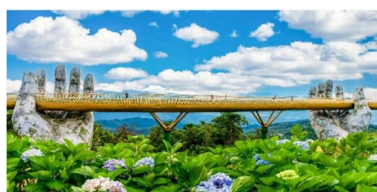
สะพานมือบานาฮิลล์