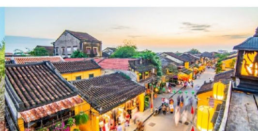
หมู่บ้านฮอยอัน

*กรณีห้องพักรับบานาฮิลล์เต็ม ขอสงวนสิทธิ์ในการเปลี่ยนวันเข้าพัก และปรับเปลี่ยนโปรแกรมโดยคำนึงถึงผลประโยชน์ลูกค้าเป็นสำคัญ