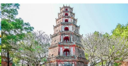
วัดเทียนมู่