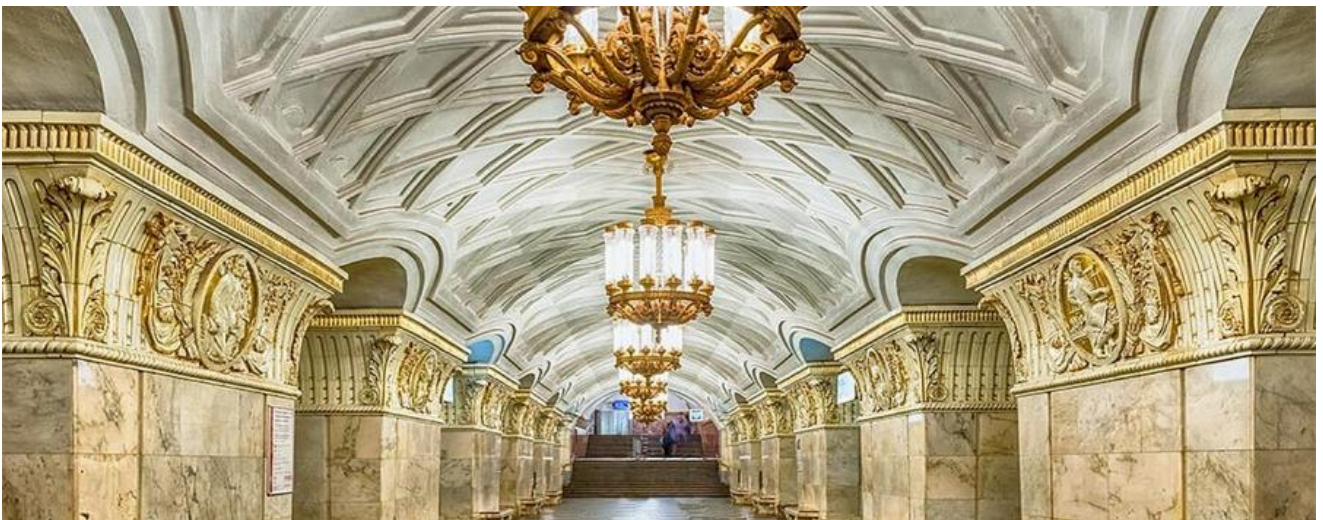
คำ รับประทานอาหารค่ำ ณ ภัตตาคาร (12)

นำท่านเที่ยวชมสถานีรถไฟใต้ดิน เป็นสถานีรถไฟใต้ดินที่สวยงามที่สุดในโลกแล้วยังมีความลึกอีกต่างหาก รถไฟใต้ดินทำให้ผู้คนสามารถเดินทางไปไหนมาไหนได้สะดวกกว่าบนถนนทั่วไป สถานีรถไฟใต้ดินเป็นสิ่งก่อสร้างที่ชาวรัสเซียสามารถอดชาวต่างชาติให้เห็นถึงความยิ่งใหญ่ตลอดจนประวัติศาสตร์ความเป็นชาตินิยมและวัฒนธรรมประเพณีอันสวยงามอันเป็นเสน่ห์ดึงดูดให้นักท่องเที่ยวเยี่ยมชมเนื่องจากการตกแต่งของแต่ละสถานีที่ต่างกันด้วยประติมากรรม โคมไฟระย้า เครื่องแก้ว และหินอ่อน