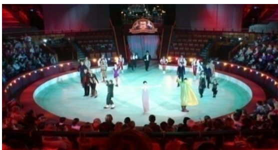
นำท่านเข้าสู่ที่พัก

พิเศษ...หลังจากนั้นนำท่าน ชมละครสัตว์ เซอร์คัส (Russian Circus) การแสดงของสัตว์แสนรู้ และโชว์มายากล กายกรรมไต่ลวด และการแสดงผาดโผนจากนักแสดงมืออาชีพ การแสดงจะมี 2 ช่วง ช่วงละ 45 นาที และพักอีก 15 นาที ระหว่างพักจะมีบริการถ่ายรูปกับสัตว์ต่างๆ