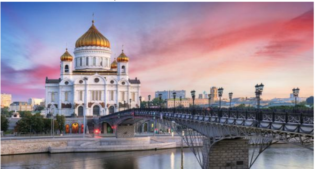
คำ รับประทานอาหารค่ำ ณ ภัตตาคาร (15)

นำท่านถ่ายรูปกับวิหารเซนต์เดอซาร์เวียร์(ด้านนอก) ( THE CATHEDRAL OF CHRIST OUR SAVIOUR ) วิหารที่สร้างขึ้นเมื่อปี ค.ศ.1839 ในสมัยพระเจ้าซาร์อเล็กซานเดอร์ที่ 1 เพื่อเป็นอนุสรณ์แห่งชัยชนะและแสดงกตัญญูตาแต่พระเป็นเจ้าที่ทรงช่วยปกป้องรัสเซียให้รอดพ้นจากสงครามโปเลียน โดยใช้เวลาก่อสร้างนานถึง 45 ปี เป็นวิหารโดมทองที่ใหญ่ที่สุดในรัสเซีย ตั้งอยู่ใจกลางเมืองติดกับแม่น้ำมอสโคว์ รอบๆ วิหารจะมีภาพหล่อโลหะเป็นรูปนักรบโบราณกับกษัตริย์ที่สวยงามและเหมือนจริงปัจจุบันวิหารนี้ ใช้ในการประกอบพิธีกรรมสำคัญระดับชาติของรัสเซีย