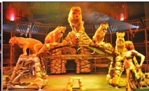
VEGA HOTEL MOSCOW*4 ดาว หรือเทียบเท่า (คืนที่ 5)