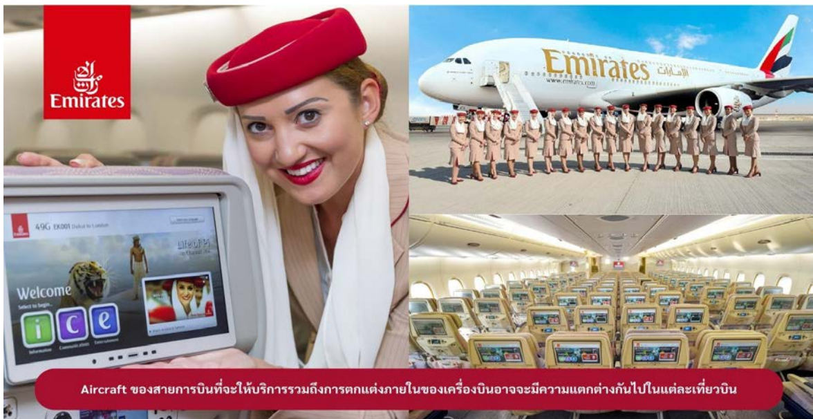
Aircraft ของสายการบินที่จะให้บริการรวมถึงการตกแต่งภายในของเครื่องบินอาจมีความแตกต่างกันไปในแต่ละเที่ยวบิน