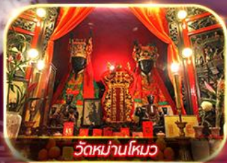
วัดหนานโหมว