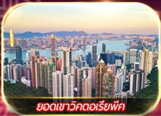
ยอดเขาวิกตอเรียพิค