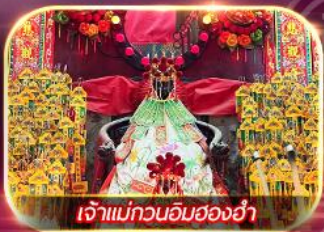
เจ้าแม่กวนอิมของฮำ