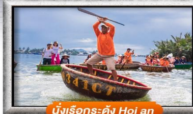
นั่งเรือระดั่ง Hoi an