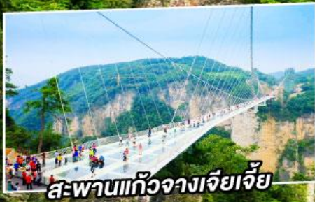
สะพานแก้วฉางเจียเจีย