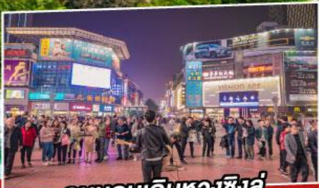
ถนนคนเดินหวงชิ่งอู่