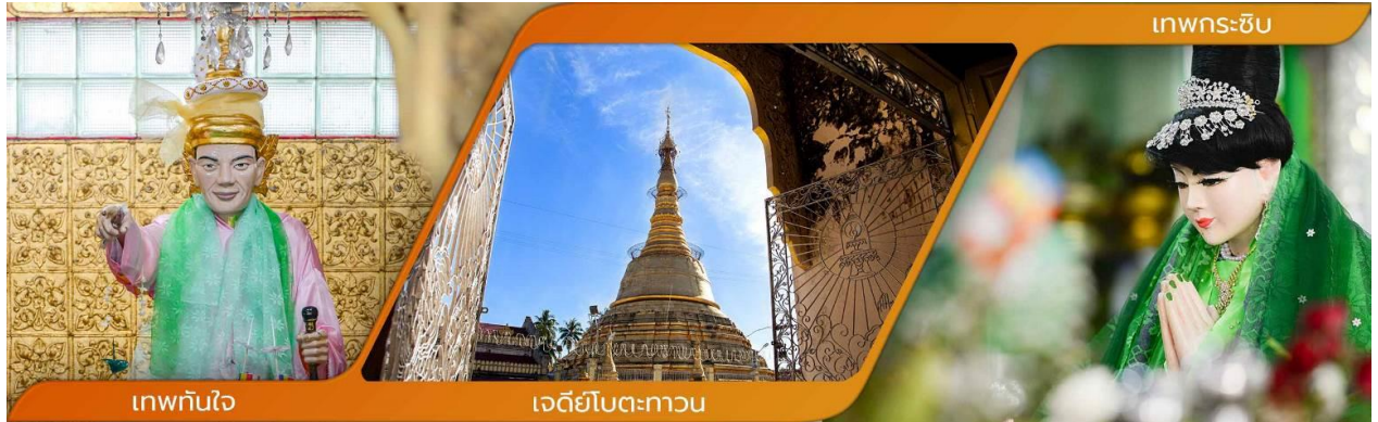
เทพทันใจ