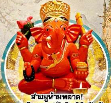
สำมูห้ามพลาด! พระพิฆเนศวัดสิหริวินัยย์ค