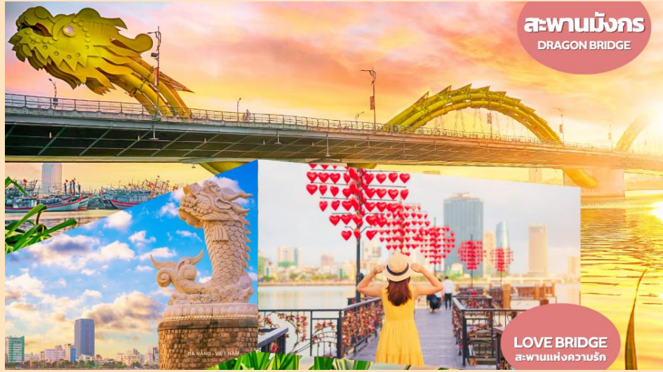
สะพานมังกร DRAGON BRIDGE

จากนั้นนำท่านชม สะพานแห่ง ความรัก (LOVE BRIDGE) ที่คู่รัก นิยมพากันมาถ่ายรูป เขียนชื่อคล้อง กุญแจบนสะพานแห่งนี้ เป็นอีกจุดที่ นิยมสำหรับวัยรุ่นและนักท่องเที่ยว สะพานมังกร (DRAGON BRIDGE) สะพานมังกรไฟสี ญ ลัก ษ ณ์ ความสำเร็จแห่งใหม่ของเวียดนาม มี ความยาว 666 เมตร ความกว้างเท่า ถนน 6 เลนส์ เชื่อมต่อสองฟากฝั่ง ของแม่น้ำฮานประเทศเวียดนาม