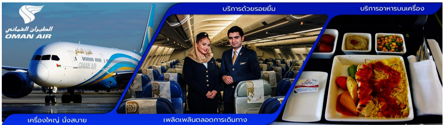
เครื่องบินใหญ่ นั่งสบาย

06:00 น. คณะผู้เดินทางพร้อมกัน ณ สนามบินสุวรรณภูมิ อาคารผู้โดยสารขาออกระหว่างประเทศ ชั้น 4 ประตูทางเข้าที่ 10 * จุดบังคับสำหรับกรุปทัวร์ นำท่านเช็คอิน เคา์เตอร์ M สายการบินโอมาน แอร์ ซึ่งมีเจ้าหน้าที่บริษัทฯ คอยให้การต้อนรับพร้อมอำนวยความสะดวกด้านสัมภาระแก่ท่าน * การจัดที่นั่งบนเครื่องบินไปตามสายการบินกำหนด *