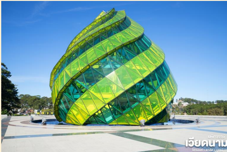
เวียดนาม