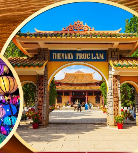
วัดตักลัม