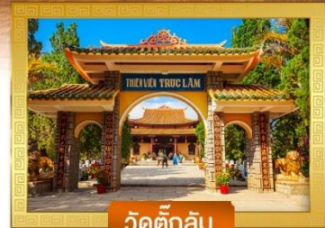
วัดตึกลิ้ม