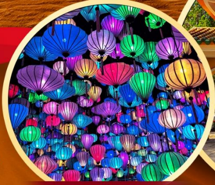
สวนแห่งแสง (Lumiere Light Garden)