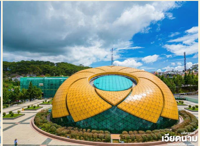
เวียดนาม