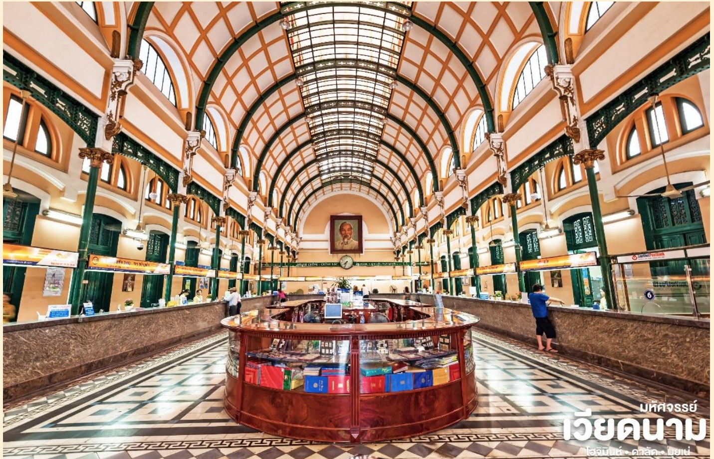
มทคจรรย เวียดนาม โฮจิมินห์ - คาลัก - ฮิเยน