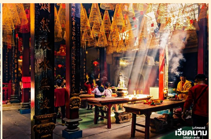
มทคจรรย เวียดนาม โฮจิมินห์ - คาลัก