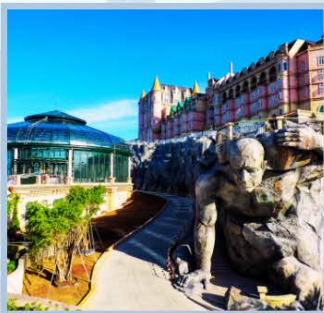
หมู่บ้านฝรั่งเศส