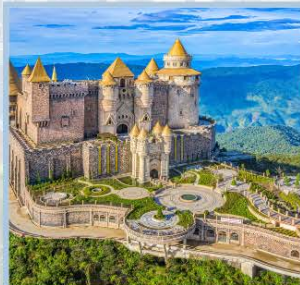
ปราสาทจันตรา