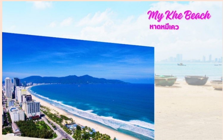
My Khe Beach หาดหมีเคว

พาชมหาดหมีเคว (My Khe Beach) ชายหาดที่สวยงามที่สุดในเมืองดานัง มีแนวโค้งตามลักษณะภูมิประเทศของเวียดนามซึ่งยาวกว่า 32 กิโลเมตร มีหาดทรายสีขาวและเม็ดทรายละเอียด น้ำทะเลสีฟ้าใส ท่านจะได้เพลิดเพลินไปกับธรรมชาติที่สวยงามทั้งวิวภูเขาและอ่าวที่อยู่ตรงข้าม อิสระถ่ายรูปเช็คอินตามอัธยาศัย