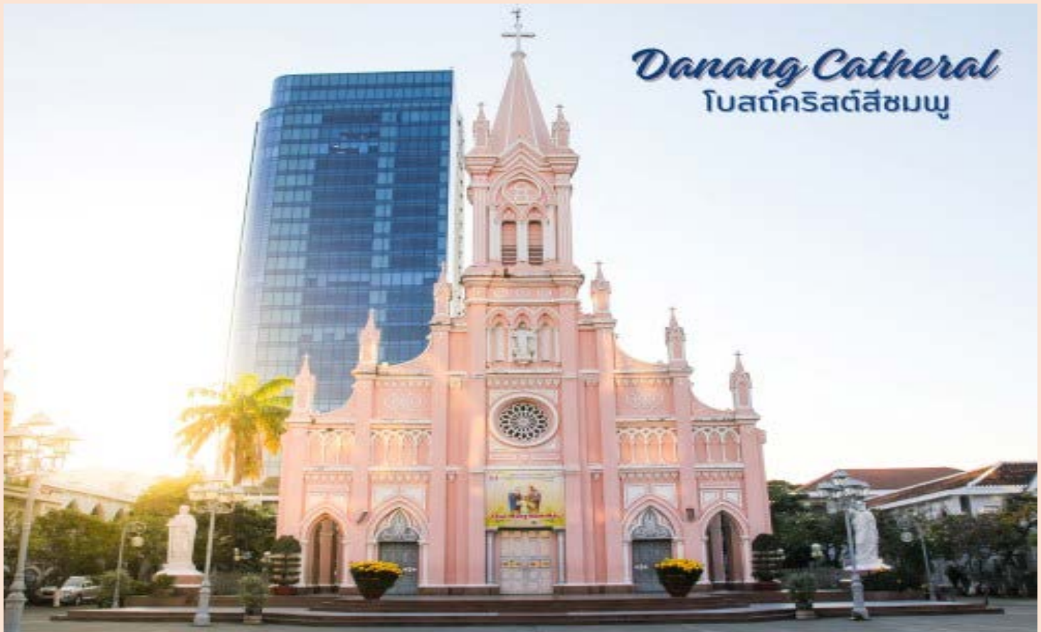
Danang Cathedral โบสถ์คริสต์สีชมพู