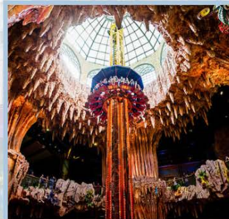
สวนสนุก Fantasy Park