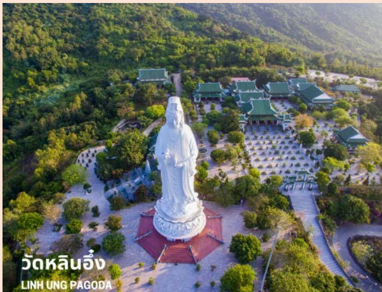
วัดหลินอิ่ง LINH UNG PAGODA

เดินทางสู่วัดหลินอิ่ง (LINH UNG PAGODA) เป็นวัดที่ใหญ่ที่สุดของเมืองดานัง อยู่บนคาบสมุทร เซินจา ภายในวิหารใหญ่ของวัดเป็นสถานที่บูชาเจ้าแม่กวอนอิมและเทพองค์ต่างๆ ไฮไลท์ของวัดนี้เป็นที่ประดิษฐานเจ้าแม่กวอนอิมยืนองค์ใหญ่สีขาว ที่มีความสูงถึง 67 เมตรตั้งอยู่บนฐานดอกบัวกว้าง 35 เมตร ยืนหันหน้าออกไปทางทะเลและหันหลังให้ภูเขา คอยปกป้องคุ้มครอง วัดนี้เป็นสถานที่ศักดิ์สิทธิ์ที่ชาวบ้านนิยมมากราบไหว้ขอพรและยังเป็นอีกหนึ่งสถานที่ท่องเที่ยวจุดชมวิวที่สวยงามของเมืองดานังอีกด้วย