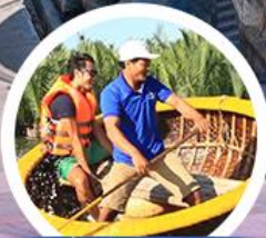
นั่งเรือกระต๊อ