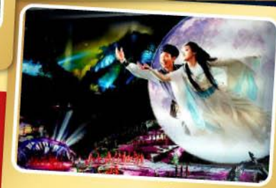
โชว์จิ้งจอกขาว