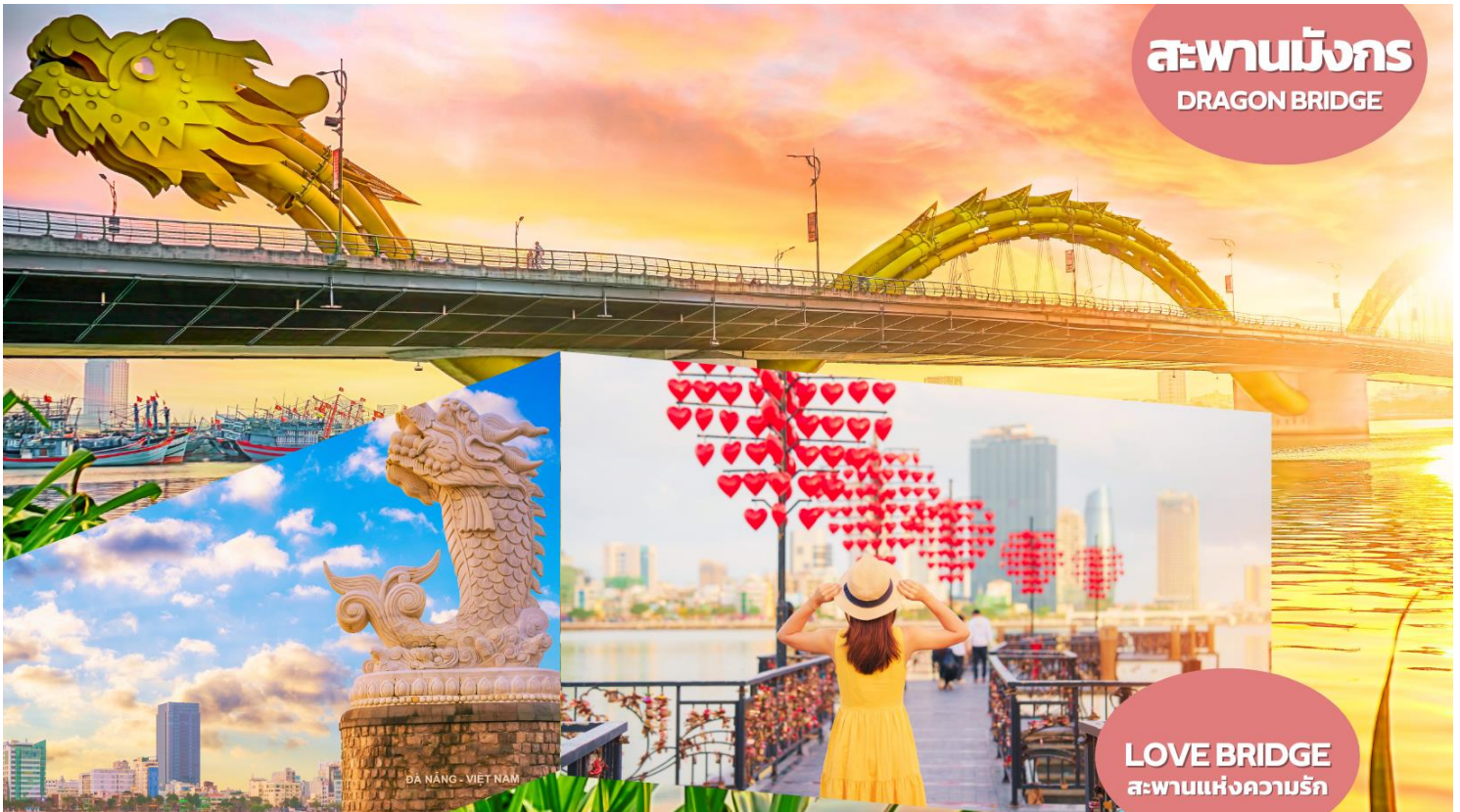
สะพานมังกร DRAGON BRIDGE

พามหาดหมีเคว (My Khe Beach) ชายหาดที่สวยงามที่สุดในเมืองดานัง มีแนวโค้งตามลักษณะภูมิประเทศของเวียดนามซึ่งยาวกว่า 32 กิโลเมตร มีหาดทรายสีขาวและเม็ดทรายละเอียด น้ำทะเลสีฟ้าใส ท่านจะได้เพลิดเพลินไปกับธรรมชาติที่สวยงามทั้งวิวภูเขาและอ่าวที่อยู่ตรงข้าม อิสระถ่ายรูปเช็คอินตามอัธยาศัย