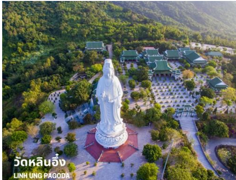
วัดหลินอึ้ง LINH UNG PAGODA

เดินทางสู่ วัดหลินอึ้ง (LINH UNG PAGODA) เป็นวัดที่ใหญ่ที่สุดของเมืองดานัง อยู่บนคาบสมุทร เซินจา ภายในวิหารใหญ่ของวัดเป็นสถานที่บูชาเจ้าแม่กวนอิมและเทพองค์ต่างๆ ไฮไลท์ของวัดนี้เป็นที่ประดิษฐานเจ้าแม่กวนอิมยืนองค์ใหญ่สีขาว ที่มีความสูงถึง 67 เมตรตั้งอยู่บนฐานดอกบัวกว้าง 35 เมตร ยืนหันหน้าออกไปทางทะเลและหันหลังให้ภูเขา คอยปกป้องคุ้มครองวัดนี้เป็นสถานที่ศักดิ์สิทธิ์ที่ชาวบ้านนิยมมากราบไหว้ขอพรและยังเป็นอีกหนึ่งสถานที่ท่องเที่ยวจุดชมวิวที่สวยงามของเมืองดานังอีกด้วย