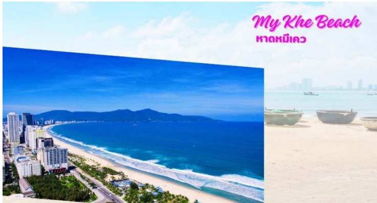
My Khe Beach หาดหมีเคว

นำท่านเดินทางกลับสู่เมืองดานัง ระหว่างทาง นำท่านแวะ ร้านเยื่อไผ่ ซึ่งเป็นร้านขายผลิตภัณฑ์ที่ทำมาจากเยื่อไผ่ ที่มีคุณสมบัติในการซับน้ำ ซับกลิ่น ได้เป็นอย่างดี โดยสินค้าที่น่าสนใจมี ครีมย้อมผมธรรมชาติจากถ่านไผ่ ชุดชั้นในจากเยื่อไผ่ หมวกคลุมซับน้ำ และ แผ่นรัดบรรเทาอาการปวดเมื่อย เป็นต้น