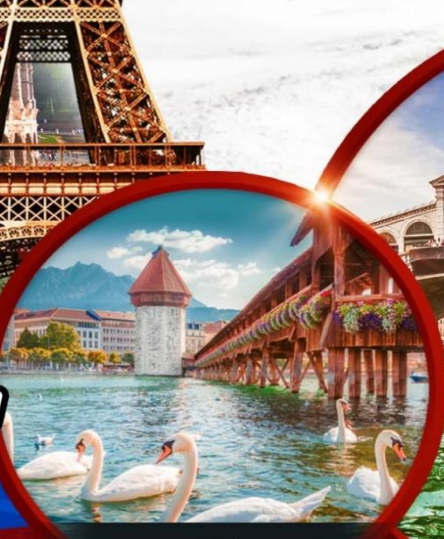
สะพานไม้ ชาเปล

วีซ่า ทิปท้องถิ่น ตัวประกันโรงแรม หอหน้าทัวร์