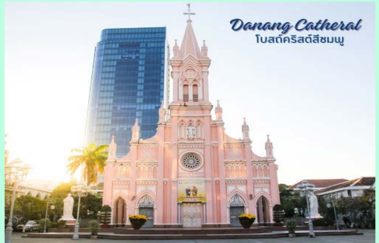
Danang Cathedral โบสถ์คริสต์สีชมพู

นำท่านถ่ายรูป โบสถ์คริสต์ดานัง หรือโบสถ์คริสต์สีชมพู (Danang Cathedral) สร้างขึ้นสมัยเวียดนามตกเป็นอาณานิคมของฝรั่งเศส สถาปัตยกรรมสไตล์โกธิก ตกแต่งด้วยความประณีตสวยงาม ตัวโบสถ์เป็นสีชมพู ทั้งหลัง ตกขอบด้วยสีขาว เป็นอีกหนึ่งสถานที่ที่ไม่ควรต้องพลาดเมื่อมาเยือนเมืองดานัง นำท่านอิสระช้อปปิ้งตลาดฮาน อิสระเลือกซื้อสินค้าหลากหลายชนิด เช่น ผ้า เหล้า บุหรี่ และของกินต่างๆ เป็นตลาดสดและขายสินค้าพื้นเมืองของเมืองดานัง