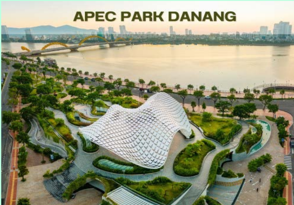
APEC PARK DANANG

เดินทางสู่ เมืองฮอยอัน (HOI AN) เป็นเมืองขนาดเล็กริมฝั่งทะเลจีนใต้ทางตอนกลางของประเทศเวียดนาม ตั้งอยู่ในเขตจังหวัดกว๋างนาม มีประชากรอาศัยอยู่ราว 80,000 คน ในอดีตเคยเป็นเมืองท่าที่ใหญ่ที่สุดในภูมิภาคเอเชียตะวันออกเฉียงใต้ ในปี พ.ศ. 2542 องค์การยูเนสโกได้ขึ้นทะเบียนเขตเมืองเก่าของฮอยอันให้เป็นมรดกโลก ด้วยเหตุผลว่าเป็นตัวอย่างของเมืองท่าในเอเชียตะวันออกเฉียงใต้ในสมัยคริสต์ศตวรรษที่ 15-19 ที่มีการผสมผสานศิลปะและสถาปัตยกรรมทั้งของท้องถิ่นและของต่างชาติไว้ได้อย่างมีเอกลักษณ์ และอาคารต่างๆภายในเมืองได้รับการอนุรักษ์ให้อยู่ในสภาพเดิมไว้ได้เป็นอย่างดี (ใช้เวลาในการเดินทางประมาณ 40 นาที) ให้ท่านได้พักผ่อนบนรถพร้อมชมบรรยากาศและวิถีชีวิตชาวบ้าน ระหว่างทางนำท่านชม หมู่บ้านแกะสลักหินอ่อน ให้ท่านเลือกซื้อของฝากเป็นที่ระลึก