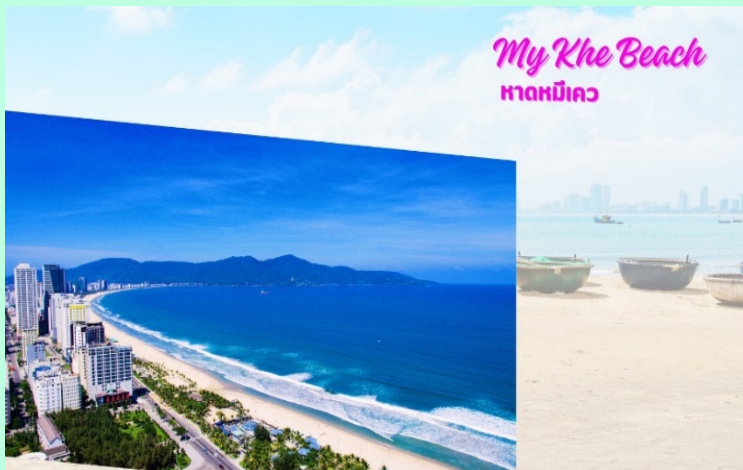
My Khe Beach หาดหมีเคว

พาทชมหาดหมีเคว (My Khe Beach) ชายหาดที่สวยงามที่สุดในเมืองดานัง มีแนวโค้งตามลักษณะภูมิประเทศของเวียดนามซึ่งยาวกว่า 32 กิโลเมตร มีหาดทรายสีขาวและเม็ดทรายละเอียด น้ำทะเลสีฟ้าใส ท่านจะได้เพลิดเพลินไปกับธรรมชาติที่สวยงามทั้งวิวภูเขาและอ่าวที่อยู่ตรงข้าม อิสระถ่ายรูปเช็किनตามอัธยาศัย