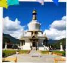
อนุสรณ์สถานทิมพู

พิชิตยอดเขา วัดทักซัง วิหารศักดิ์สิทธิ์ของชาวพุทธ เที่ยวครบ พาโร ทิมพู พูนาคา 5วัน 4คืน