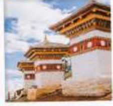
จุดชมวิวโตซูล่า