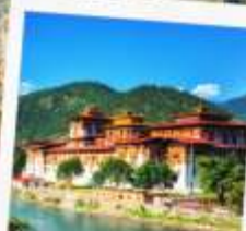
พูนาคาซอง