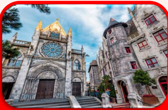
โบสถ์เซนต์ เดนิส