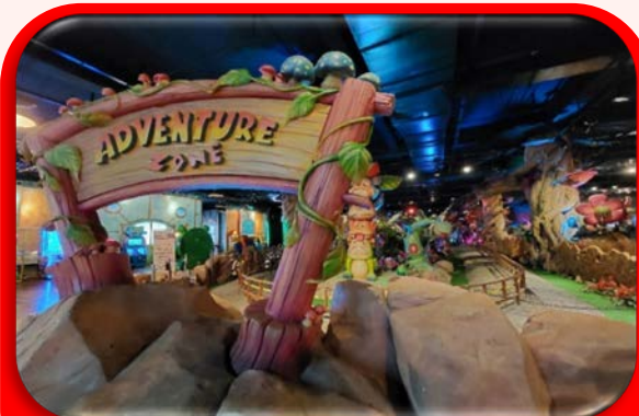
โซน Fantasy Park