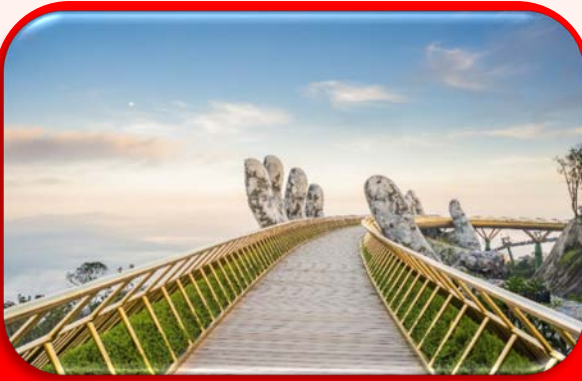
สะพานมือทองคำ