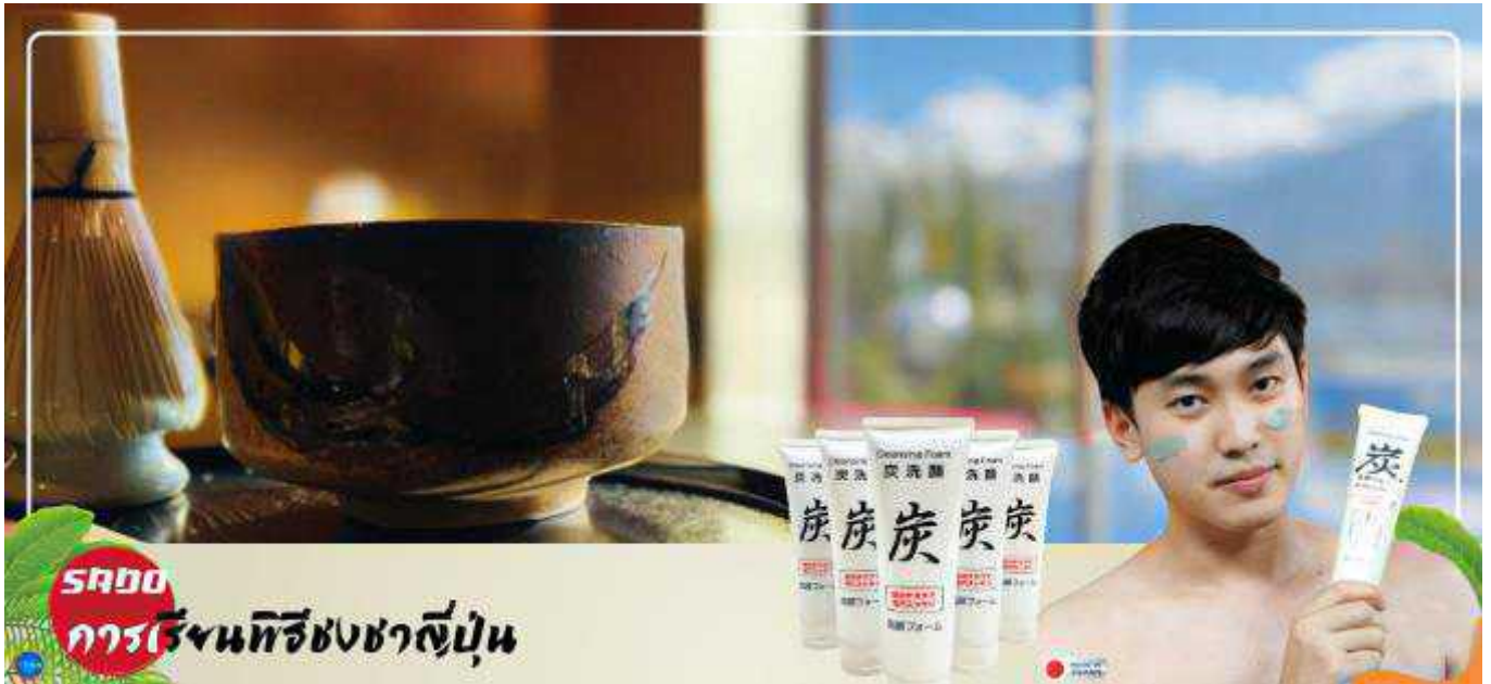
SADO การเรียนรู้พิธีชงชาญี่ปุ่น

วันที่สี เมืองยามานาชิ – การเรียนพิธีชงชาญี่ปุ่น – กรุงโตเกียว – ชมแมวยักษ์ 3 มิติ พร้อมช้อปปิ้ง ย่านชินจูกุ – ย่านโอไดบะ – ห้างไดเวอร์ซิตี – เมืองนาริตะ