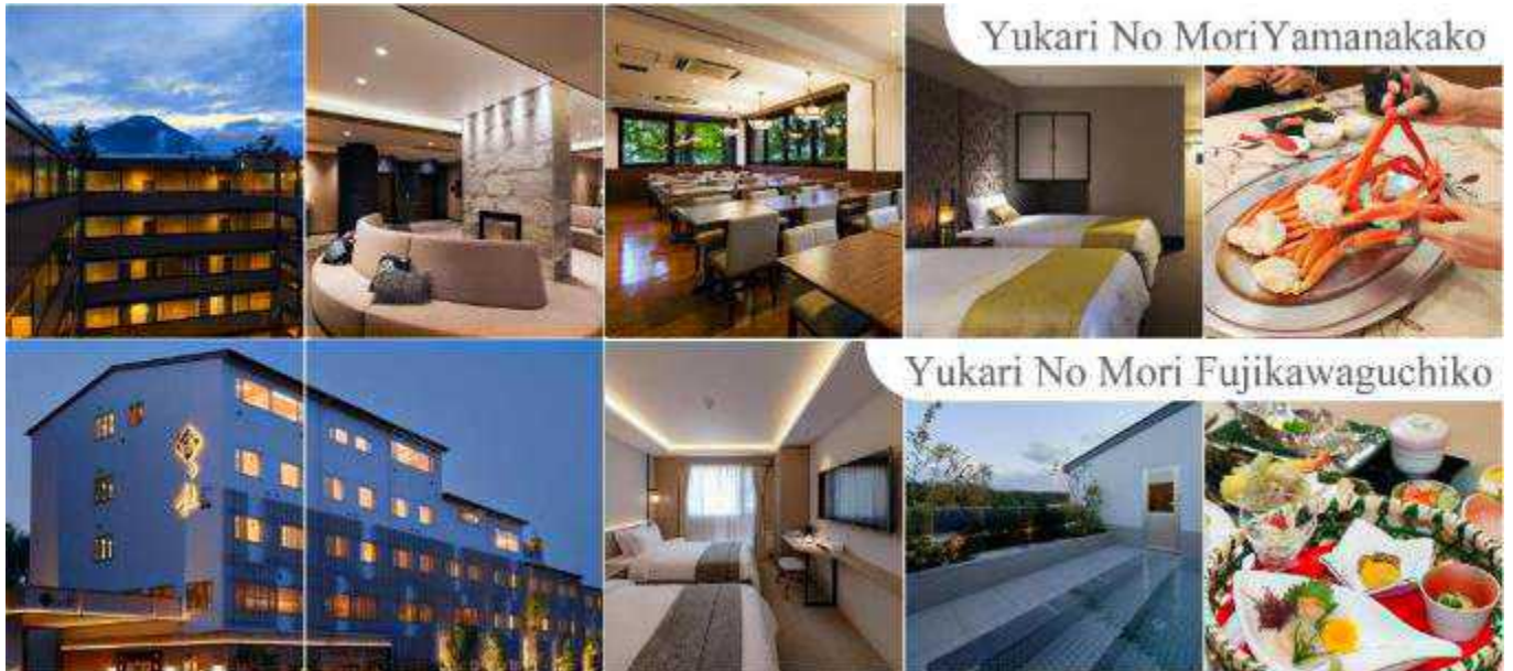
Yukari No Mori Yamanakako