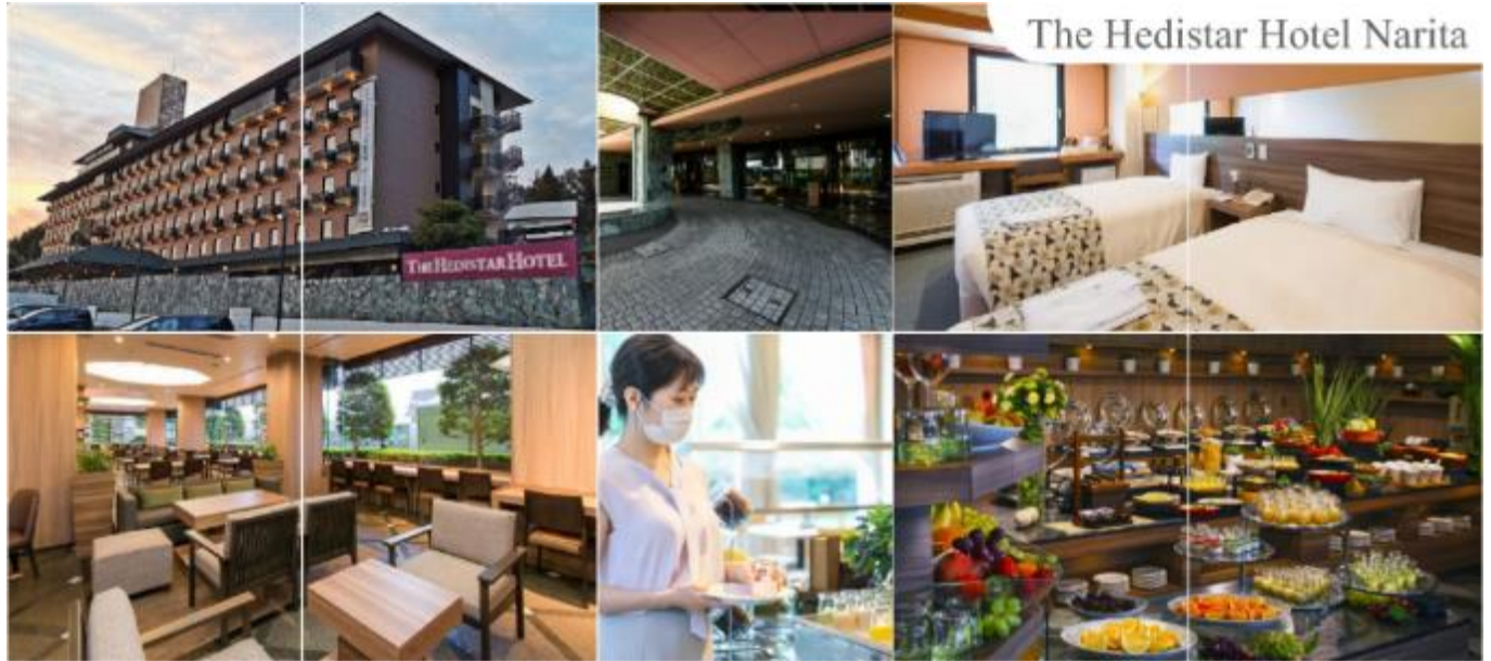
The Hedistar Hotel Narita